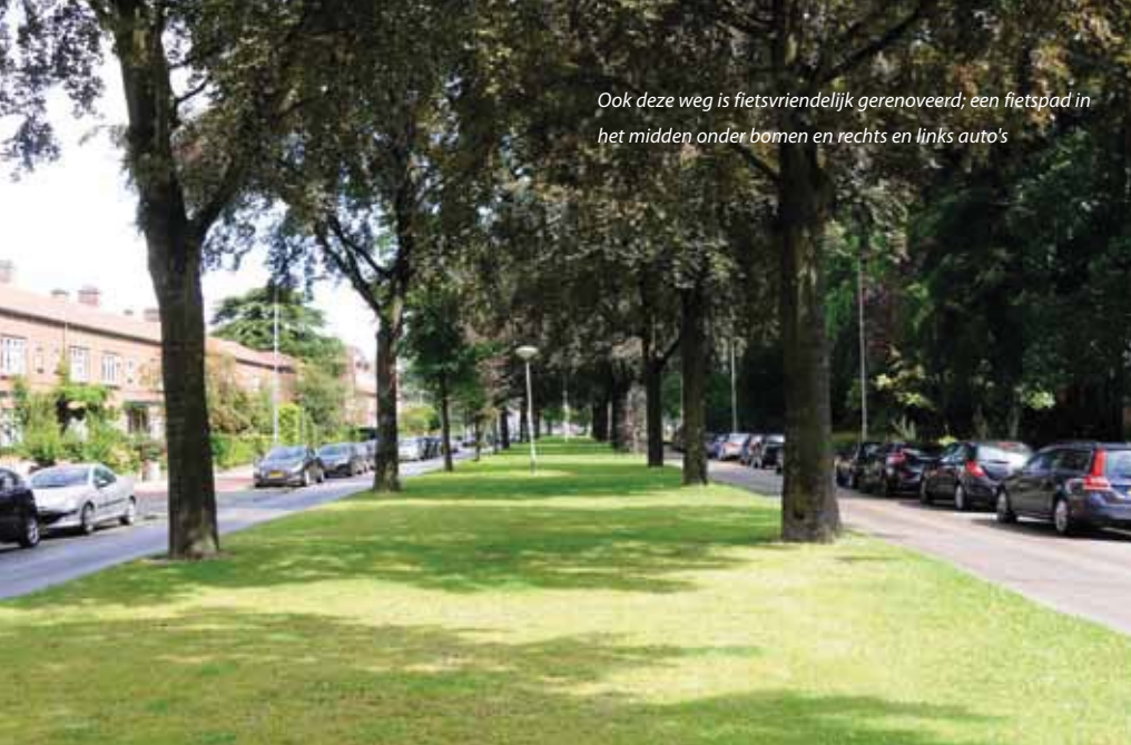
Ook deze weg is fietsvriendelijk gerenoveerd; een fietspad in het midden onder bomen en rechts en links auto's