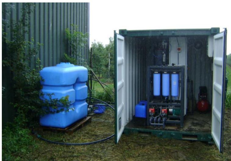
Afbeelding 1. Toepassing van CapDI-systeem in de vollegronds landbouw. Het systeem, hier met vier ontziltingsmodules, is geplaatst in een achtvoets container. Links een buffertank waar gezuiverd water tijdelijk in wordt opgeslagen.

technologie gebruikt, waarmee zout uit water wordt onttrokken met behulp van een potentiaalverschil over elektrodes [2]. In tegenstelling tot de in de tuinbouw al toegepaste techniek van omgekeerde osmose kan een bepaald (door de eindgebruiker specifiek voor zijn situatie gekozen) percentage zout verwijderd worden zonder het water meteen van alle ionen te ontdoen. Dit is voor beregening in de vollegronds landbouw ook niet nodig, omdat daarmee waardevolle nutriënten uit het water worden onttrokken. Voordelen van een lager zoutverwijderingspercentage zijn dat het energieverbruik lager en is de water recovery hoger. Het is de verwachting dat, in combinatie met meer onderzoek naar zouttolerantie van gewassen, zo het 'optimale' beregeningswater gecreëerd kan worden. In combinatie met druppelirrigatie kan ook het waterverbruik worden gereduceerd en kan een grotere opbrengstzekerheid worden behaald.