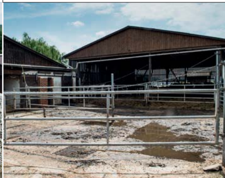
De wachtruimte is buiten op het erf gerealiseerd