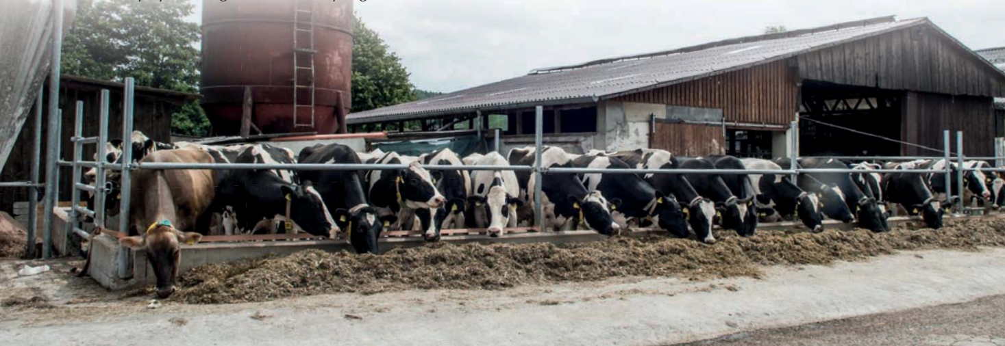
De uitloop op het erf geeft extra mestopslag en extra vreetruimte

Ondanks dat de omstandigheden niet ideaal zijn, zijn Corien en Hidde heel erg blij met de kans die ze op dit bedrijf hebben gekregen. 'Voordat we begonnen aan onze zoektocht hadden we eigenlijk geen wensenlijst', vertelt Corien. 'Uiteindelijk moet je vooral kijken wat er mogelijk is. En toen dit bedrijf op ons pad kwam, bleek dit haalbaar.' Hidde vult aan: 'De gebouwen zijn niet luxe en het bedrijf is niet van ons, maar het was en is een goed lopend bedrijf.'