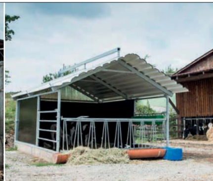
Voor ze naar de opfokker gaan, verblijven de jonge kalveren in deze kalverhut

ten, naar een bosgebied. Dan gaat er een stier mee.