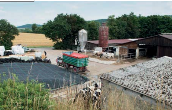
De bestaande gebouwen op het pachtbedrijf zijn behoorlijk oud