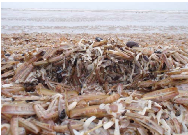
Figuur 1: Massaal angespoelde mesheften op het strand bij Katwijk

Massale sterfte van schelpdieren is niet bijzonder. Van mesheften is bekend dat deze massaal kunnen aanspoelen langs de Nederlandse stranden (Figuur 1). Deze schelpdieren zitten vaak in zeer dichte banken voor de Nederlandse kust. Het is niet helemaal duidelijk wat de massale sterfte van deze mesheften veroorzaakt maar lijkt een combinatie van zuurstofloosheid na een algenbloei en een verminderde conditie na paaien Cadée (2001).