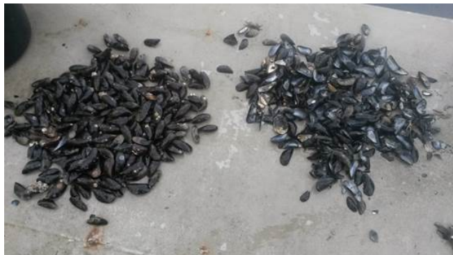
Figuur 5: Sterfte op een perceel in de Oosterschelde in november 2014. Links de levende mosselen (58%) en rechts de peulen (42%). (Foto Harry Heidekamp).

Als er mosselsterfte optreedt op een perceel kan dit worden gemeld bij de vakdeskundige visserij van het ministerie van EZ. De sterfte in een bestand wordt berekend aan de hand van het aantal "verse peulen", lege schelpen zonder aangroei aan de binnenkant (Figuur 5). Als de sterfte in korte tijd meer dan 15% bedraagt spreekt men van een abnormale of verhoogde sterfte. Als er een verhoogde sterfte wordt waargenomen, zonder dat er een direct verband gelegd kan worden met omgevingsfactoren (zuurstofloosheid, lage zoutgehalten, etc.), wordt er een onderzoek gestart om betrokkenheid van ziekteverwekkers uit te sluiten dan wel aan te tonen. De sterfte worden dan aange meld bij de NVWA (meldkamer tel. 0900-0388 of via email: info@nvwa.nl). De NVWA kan dan een bemonstering laten uitvoeren door de vakdeskundige visserij van het ministerie van Economische Zaken die zal worden opgestuurd naar het Centraal Veterinair Instituut (CVI). Als er verdenkingen zijn op andere oorzaken kunnen er ook nog schelpdiermonsters worden genomen die door IMARES worden onderzocht op algemene conditie (parameters als vleespercentage, gonaden, filtratiesnelheid) of kunnen er omgevingsvariabelen worden gemeten.