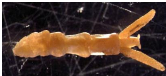
Figuur 4: De parasiet Mytilicola intestinalis . De twee uitsteeksels aan de rechterzijde zijn eipakketten (grootte 9 mm).

Het is bekend dat parasieten en ziektes door virussen en bacteriën ook kunnen leiden tot grote sterfte onder schelpdieren. Vibrio 's spelen mogelijk een rol bij de zomersterfte onder juveniele oesters in Frankrijk. Ook leidt het oesterherpesvirus (Ostreid herpesvirus 1; OshV-1) tot grote sterfte onder Japanse oesters. OshV-1 is ook infectieus voor platte oesters en een aantal andere schelpdieren. Er zijn geen aanwijzingen dat de mossel gevoelig is voor OshV-1. (Kamermans e.a., 2013). Een bekende eencellige parasiet bij platte oesters is Bonamia ostreae . Deze exoot, die in 1980 in de Oosterschelde is geïntroduceerd heeft geleid tot grote sterfte onder platte oesters. In tegenstelling tot de meeste andere schelpdieren zijn er in het algemeen maar weinig ziekteverwekkers beschreven die een grote impact kunnen hebben op de mosselpopulatie (Haenen e.a., 2011).