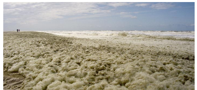
Figuur 2: Schuim op het strand als gevolg van een bloei van Phaeocystis . (bron: De Vleet)