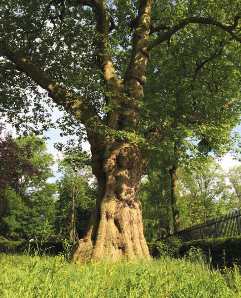
Plataan in de gemeente Leidschendam-Voorburg.

die door de stad komen te hangen, bijvoorbeeld in een stadspark of in het stadhuis. Zo vertellen we op een toegankelijke manier het verhaal van de boom, de mens en de omgeving. In oktober verschijnt de shortlist van tien genomineerde bomen en daarvan gaat er één met de hoofdprijs vandoor. De winnaar krijgt de zorgbelofte van een school of groep bewoners in de buurt. De verkiezing wordt ondersteund door een website en sociale media. Het leuke is dat we dit de komende vier jaar kunnen herhalen; ieder seizoen levert een nieuwe winnaar op. De winnaar van vijf jaar geleden was boom Berry. De boom staat aan de IJssel en heeft een heldenstatus onder jongeren. Hij kreeg zijn eigen Facebook-pagina met tweehonderd volgers, waarop hij vertelt wat er allemaal in zijn buurt gebeurt: 'Ik hoesel al die mensen. Iedereen valt voor mij.' https://www.facebook.com/bdeboom