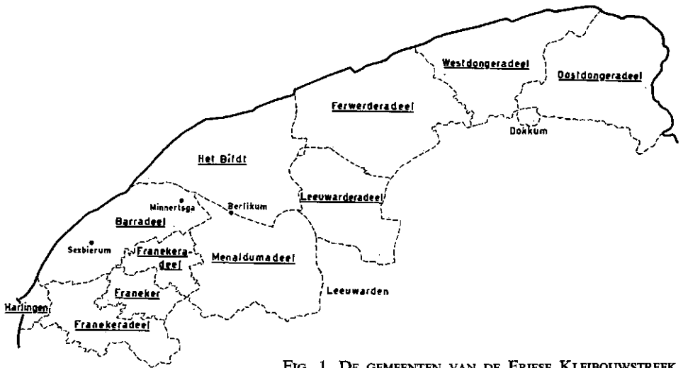
FIG. 1. DE GEMEENTEN VAN DE FRIESE KLEIBOUWSTREEK

zou het benodigde aantal arbeidskrachten inderdaad minder snel dalen dan zonder tuinbouw. Het is echter niet waarschijnlijk dat de boeren dit zullen doen. De tuinbouw is hun geheel vreemd en het is voor hen zeer de vraag of zij door middel van tuinbouw hun inkomen zouden kunnen vergroten. Vanuit deze groep kan dan ook binnen bijvoorbeeld de eerstkomende tien jaar nauwelijks een uitbreiding van de tuinbouw worden verwacht.