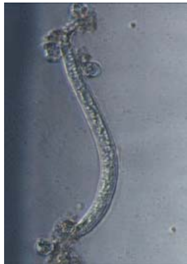
Figure 1. A nematode trapped by several amoebae that eventually entirely engulf it. For a time-lapse video see http://onlinelibrary.wiley.com/doi/10.1111/1462-2920.12949/supinfo (in Supporting Information).

While most soil biologists/ecologists consider