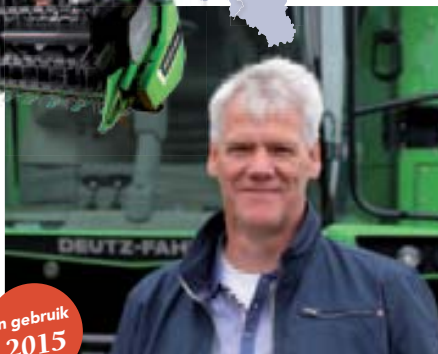
in gebruik 2015