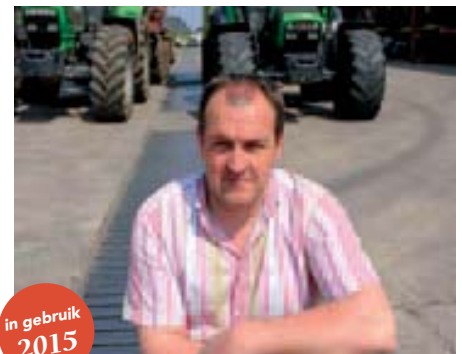
in gebruik 2015