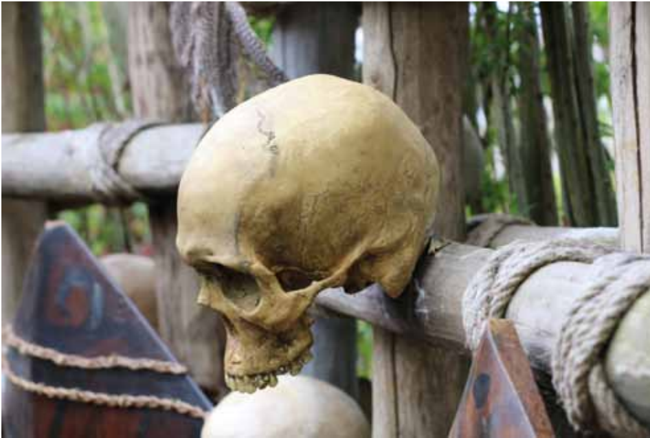
Niet iedere bezoeker overleeft een bezoek aan de dierentuin