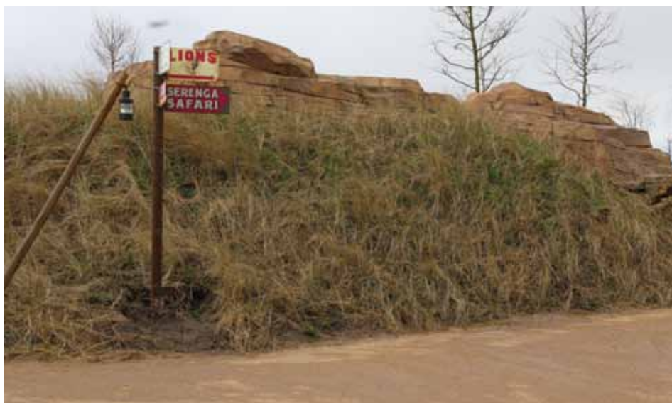
Oer-Hollands zwenkgras lijkt het meest op het gras van de Afrikaanse savanne

www.stad-en-groen.nl/artikel.asp?id=41-5823