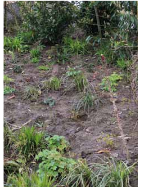
Inplanten van een jungle vraagt dat je alles wat je als hovenier geleerd hebt opzij moet zetten.

De Groencombinatie is inmiddels ontbonden omdat het park is opgeleverd, maar Volkerwessels heeft nog wel de taak om de losse eindjes op te lossen.