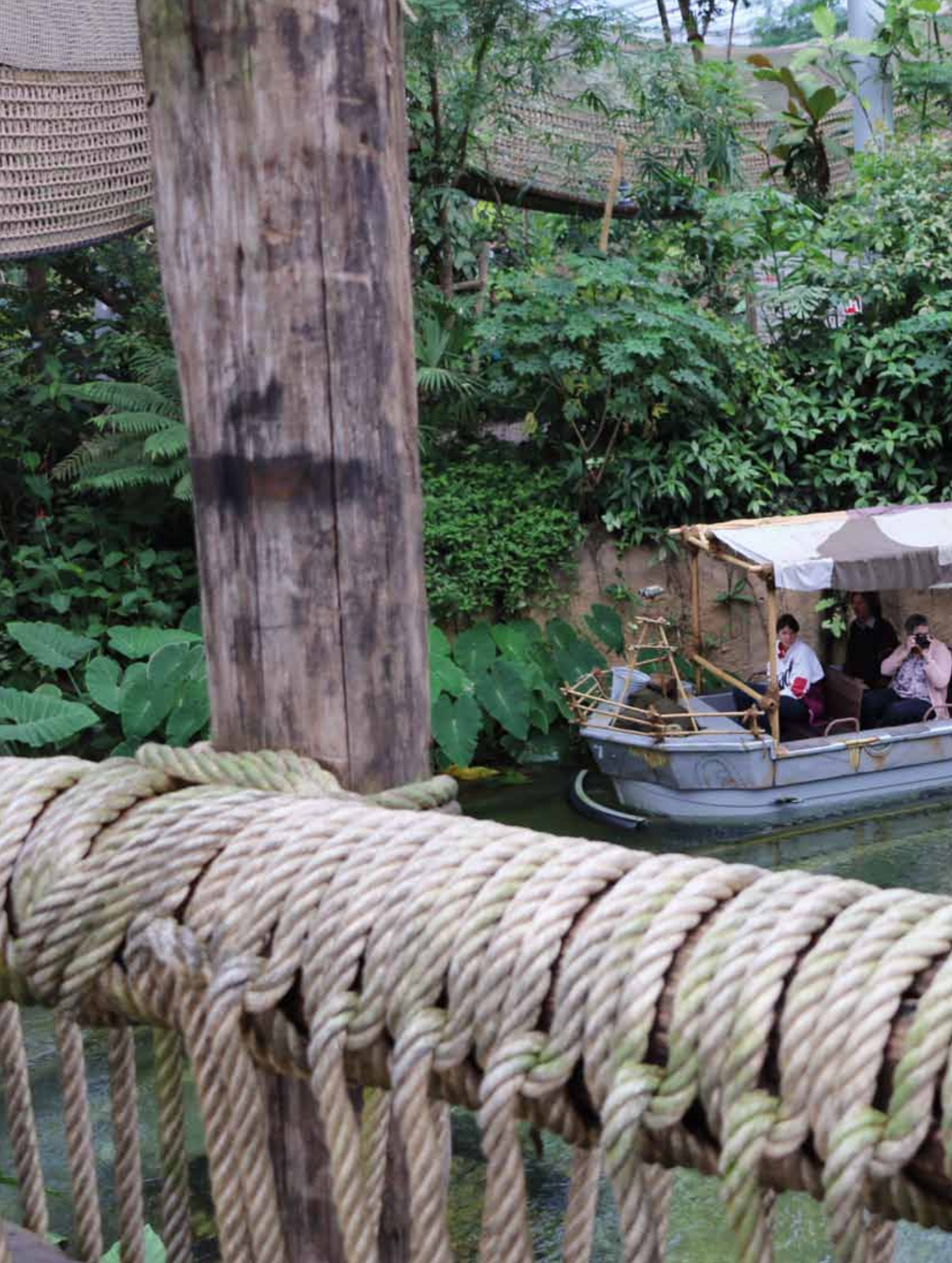
bootje in Jungola.