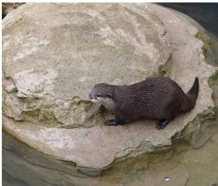
Alle dieren worden gepresenteerd in een zo natuurlijk mogelijk omgeving.

Ook de andere bomen zijn door vakkundig gemaltraitieerd, zodat ze authentieker ogen