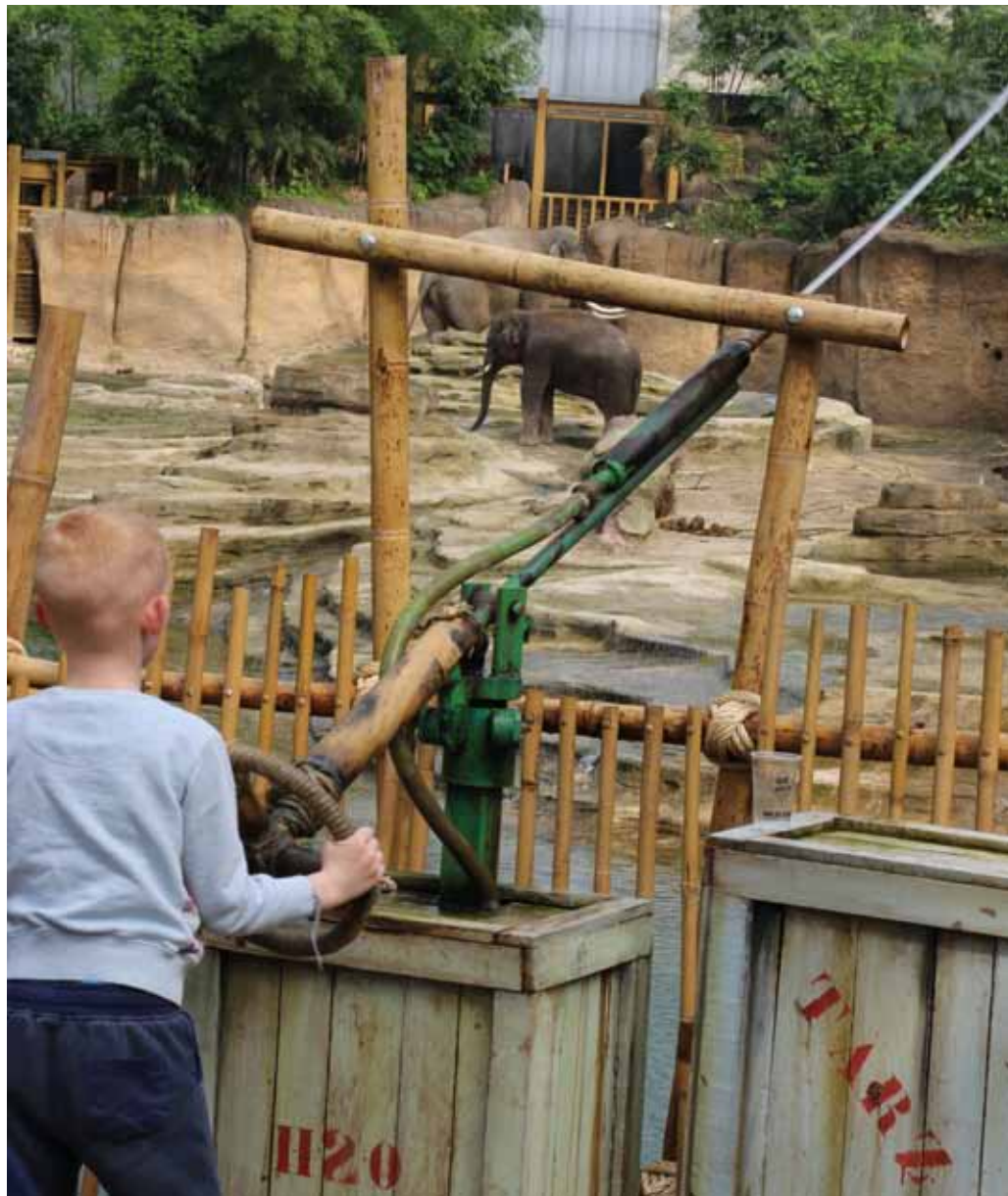
Alles is gericht op beleving.

Dat ging vaak over kleine details, bijvoorbeeld de manier waarop een hangbrug met touwen werd samengebonden