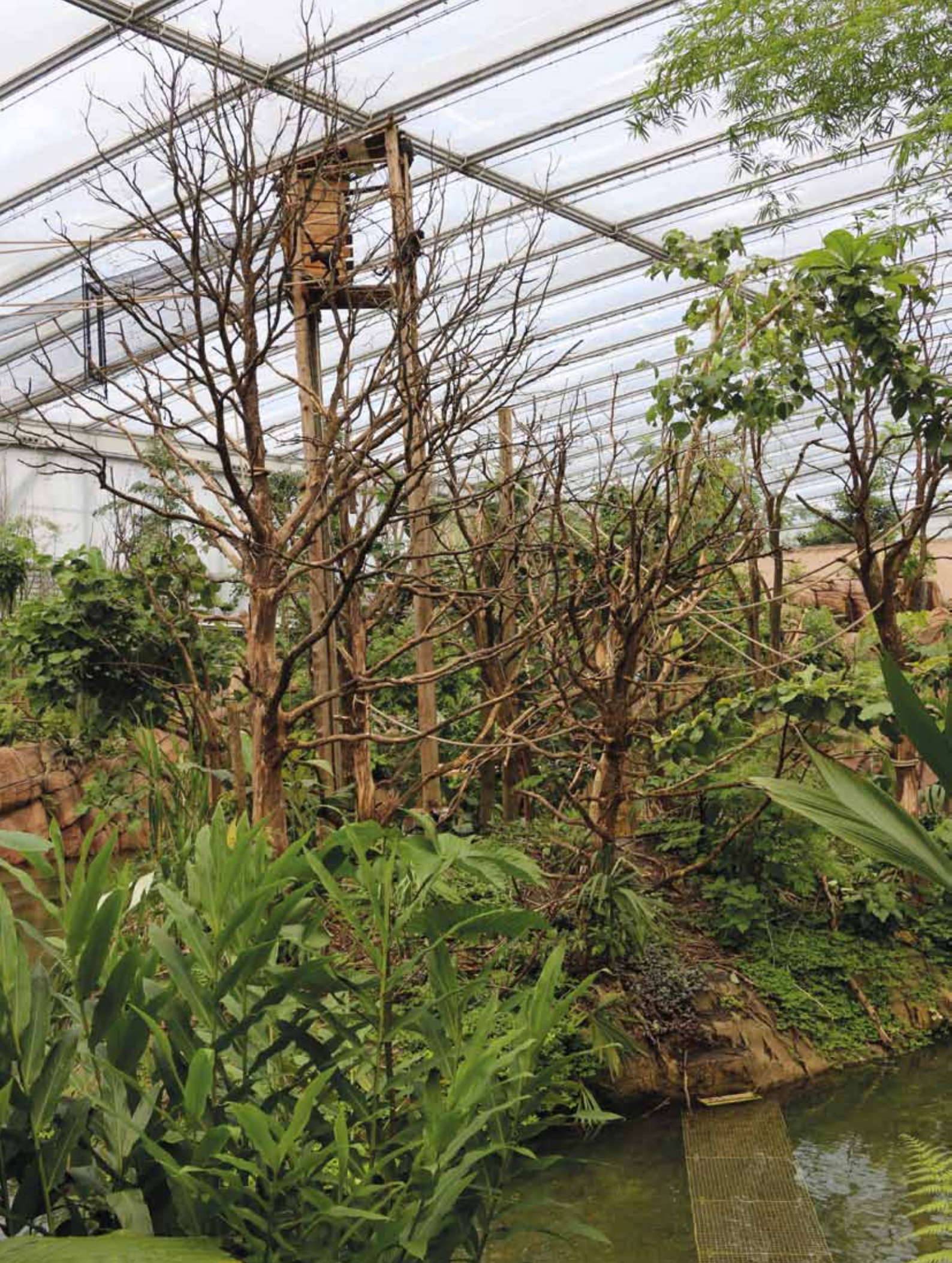
Eiland in het overdekte deel van de Jungola met aantal slingerapen.