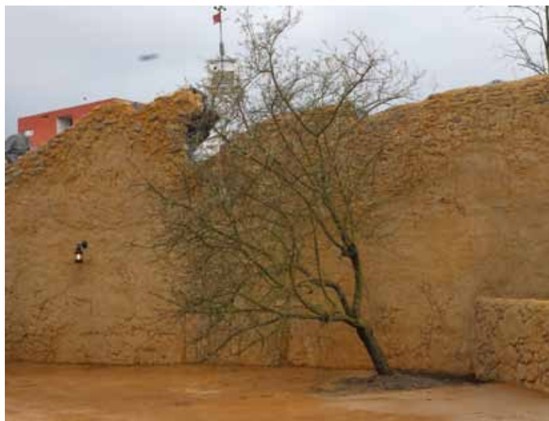
Een beetje schuin planten en misschien wat mishandeling geeft de juiste Afrikaanse look en feel.