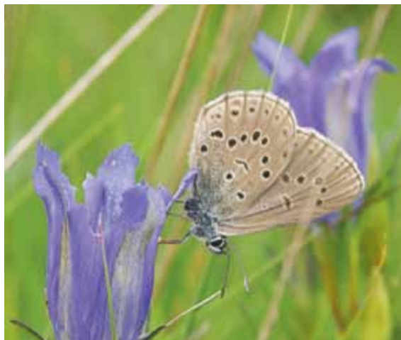
Het gentiaanblauwtje ( Phengaris alcon ) wordt vaak als heidesoort gezien, terwijl deze vroeger veel meer voorkwam in licht gebufferde blauwgraslanden en met leem aangerijkte heide.

teren van de uitgevoerde herstelmaatregelen is nog niet goed bekend. Wel lijkt het herstel na chopperen sneller op te treden dan na plaggen, en nemen de pioniersoorten sterker toe wanneer aanvullend wordt bekalkt. Dit suggereert dat herstel van het zuurbufferend vermogen ook positief uitpakt voor het herstel van fauna. Een verhoging van de afbraaksnelheid van organisch materiaal, maar ook een verbetering van de voedselkwaliteit van de vegetatie zijn daarin waarschijnlijk sturend (Wallis de Vries et al., 2014).