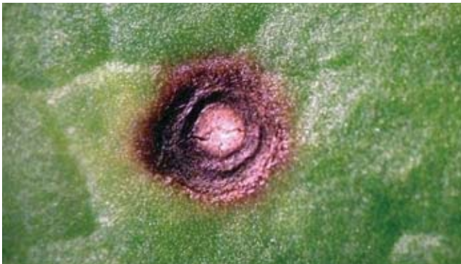
Een vlekje veroorzaakt door pseudomonas , gemakkelijk te verwarren met cercospora en de latere (bruine) vlekken van stemphylium .

Daarnaast is het weer een bepalende factor. Elke bladschimmel kent zijn eigen optimale infectie-omstandigheden. Als het (micro)klimaat in het gewas hieraan voldoet, dan kan de bladschimmel snel ontwikkelen en een epidemie in het gewas veroorzaken. Hoe korter de rotatie met waardplanten van de betreffende bladschimmel, hoe hoger de druk van deze schimmel. Bij een hogere druk ontstaan tegelijkertijd meer infecties in het perceel en zal dus sneller het eerste vlekje gevonden worden. De gevoeligheid van het gekozen bietenras voor bladschimmels is ondergeschikt aan de hierboven genoemde factoren.