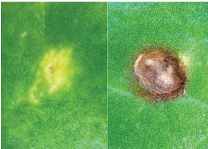
Links een geel vlekje veroorzaakt door stemphylium. Dit vlekje wordt later bruin zoals het rechter vlekje. Ook dit is een vlekje stemphylium (met veel sporen). Verwar het niet met pseudomonas!

W elk fungicide u het beste kunt kiezen, hangt af van de bladschimmel die uw gewas aantast (roest, meeldauw, ramularia, cercospora of stemphylium). Goede en tijdige herkenning ervan voorkomt onnodige bespuitingen en zorgt voor een effectieve bestrijding. Dat wil zeggen: het juiste tijdstip en het juiste middel.