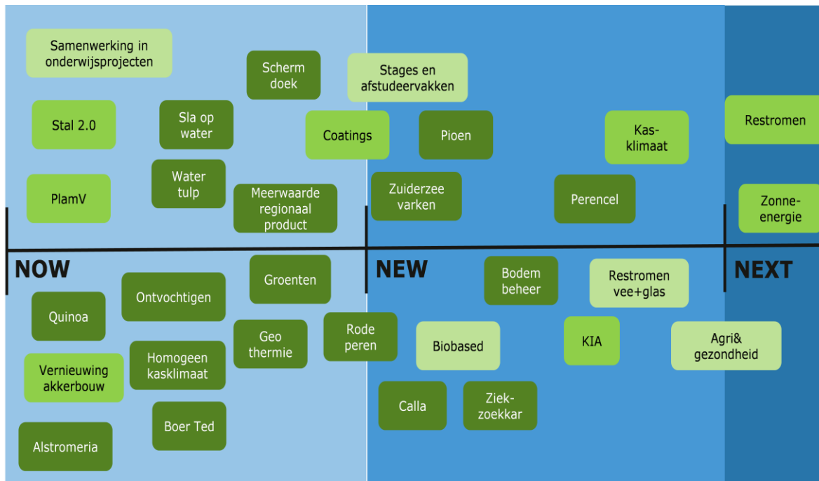
Figuur 3. Mate van vernieuwing, de activiteiten van Agrivizier geplaatst op een tijdschaal

De reflectie begon met een kanttekening bij de mate van vernieuwing die een project als Agrivizier kan realiseren. Doordat Agrivizier tot doel heeft het MKB te ondersteunen in haar vernieuwing, richten de activiteiten zich vooral op het NOW. Zoals een deelnemer toelichtte 'ondernemers zien liefst zo snel mogelijk resultaat. Ze denken wel eens aan morgen, maar zijn toch vooral met nu bezig'. Toch zijn er ook ondernemers die bezig zijn met de toekomst van de sector.