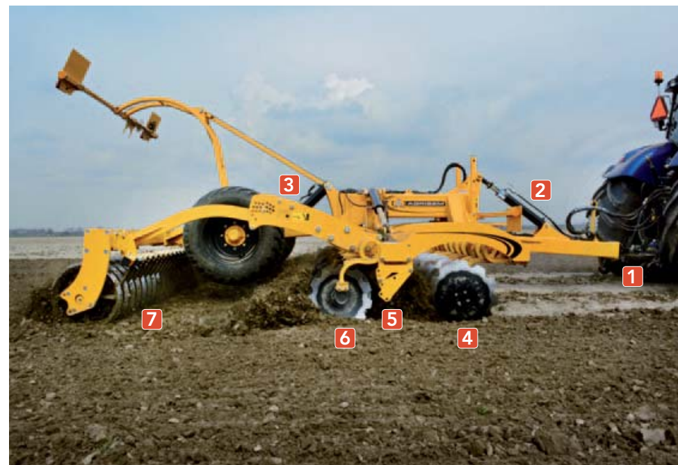
^ Van voor naar achter De Agrisem Disc-O-Mulch Gold hangt in de trekhaak [1]. Met de cilinder op de dissel [2] en met de hoogteverstelling [3] van de wals stel je de werkdiepte in. De eerste rij schijven [4] werpt de grond tegen het verstelbare kluitenbord [5]. De tweede rij schijven [6] is net als de eerste verend opgehangen. Alleen de lagers van het wielstel en de V-sem-wals [7] moet je smeren.