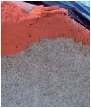
Wortelpulp over de cigarant ingekuuld, het helpt om schimmelvorming tegen te gaan.