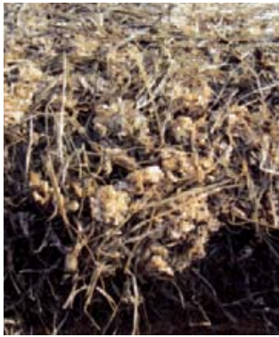
Gebroken perspulp over een natte herfstkuil. De pulp neemt vocht op uit het gras.