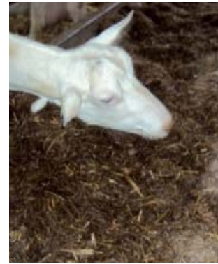
Het rantsoen is goed gemengd en erg smakelijk.