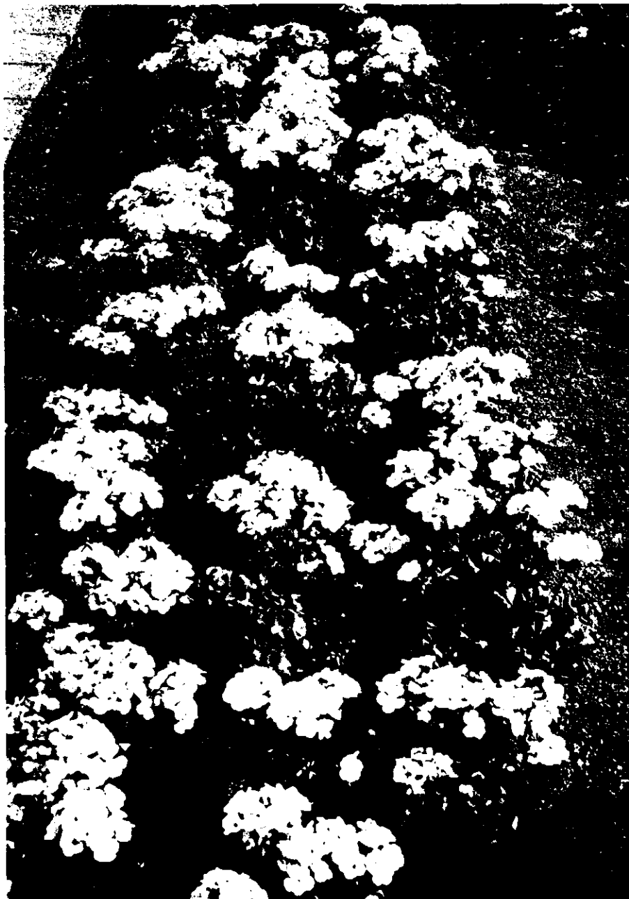
Pelargonium Fl hybride 'Video Mix': waardevolle aanwinst qua gewas, kleur en zeker als mengsel