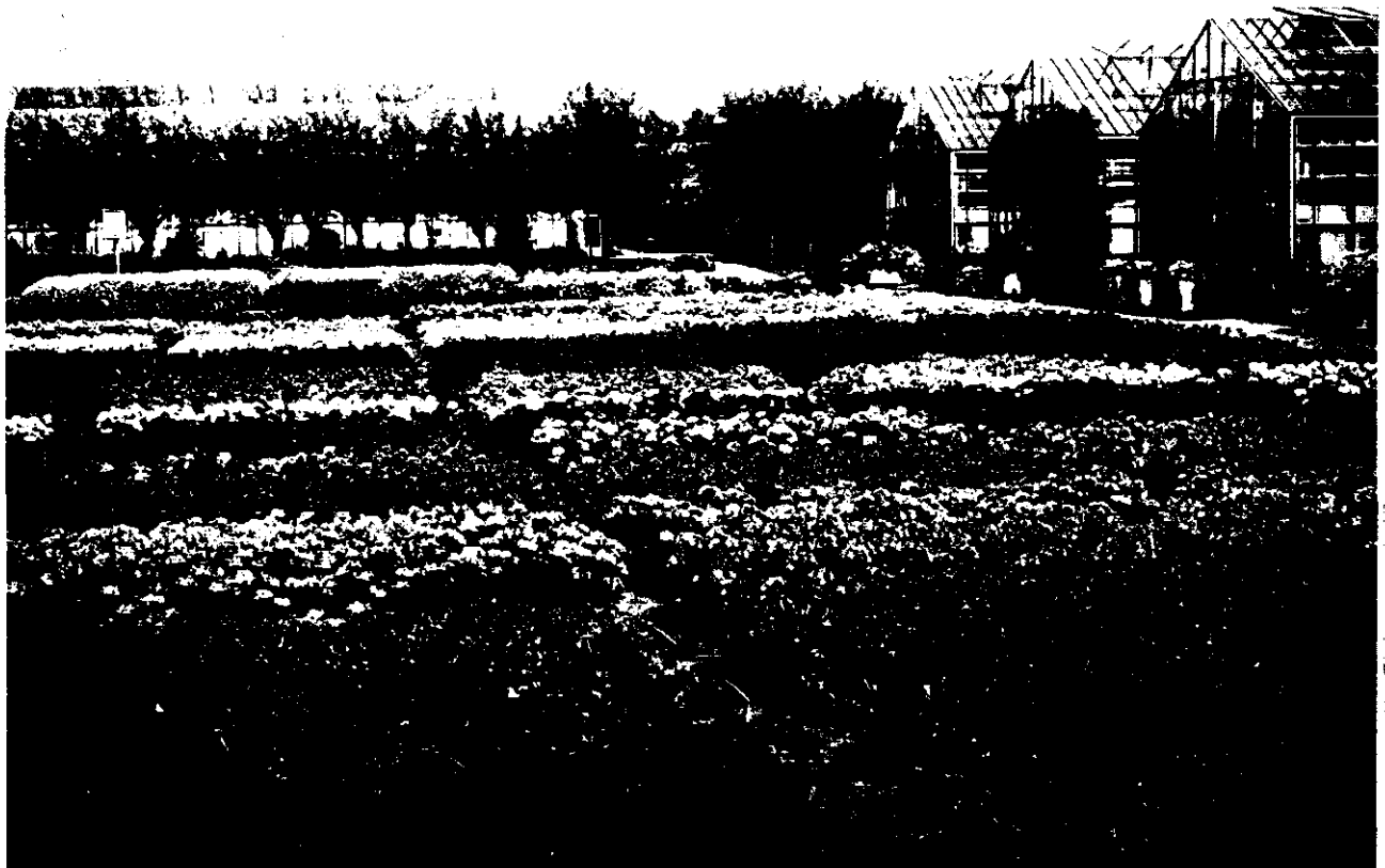
Overzicht opplanting Pelargoniumsortiment

Bodger Seeds L.T.D U.S.A. L. Clause Frankrijk L. Daehnfeld Denemarken Denholm Seeds U.S.A. Fides B.V. Nederland Floranova L.T.D. Engeland Goldsmith Seeds U.S.A. Pan American Seeds U.S.A. Pannevis Nederland Proefstation Aalsmeer Nederland Royal Sluis Nederland Werkrode Scholing Nederland Van Zanten en Co. Nederland