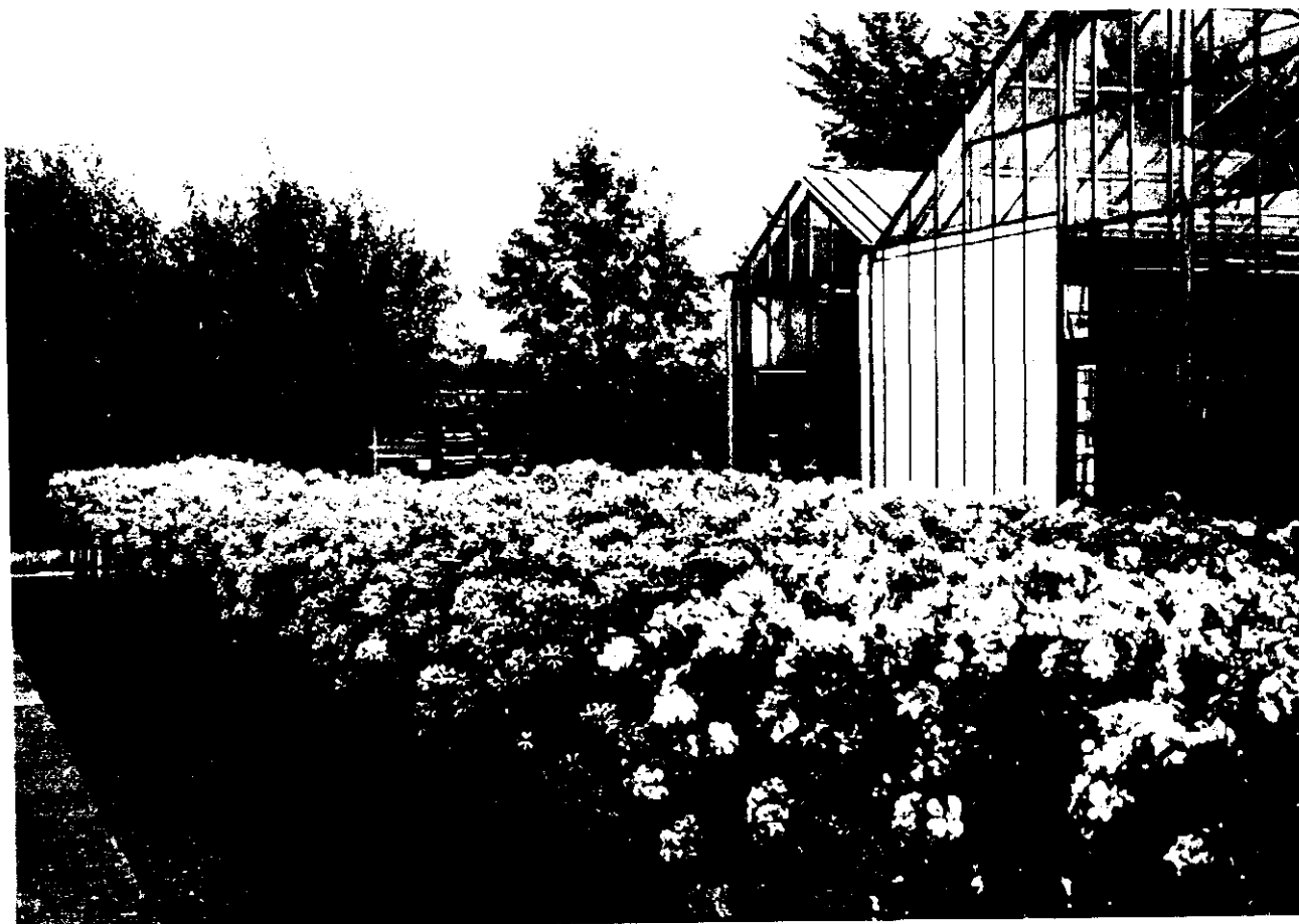
Overzicht opplanting Pelargonium peltatum