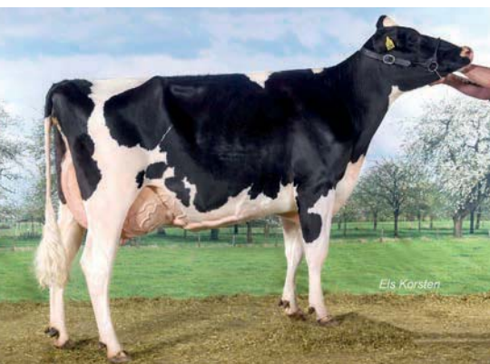
De Crob Pippa Uno (v. Numero Uno), kampioene midden Prod.: 2.03 306 10.248 3,96 3,10 lw 110