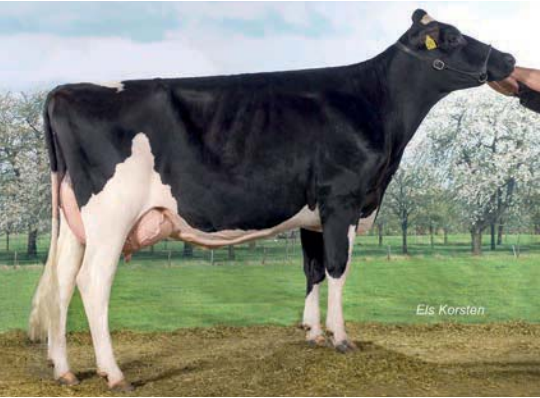
Leoni 35 (v. Ross), kampioene vaarzen Vsp. prod.: 2.01 305 9775 3,53 3,22 lw 104