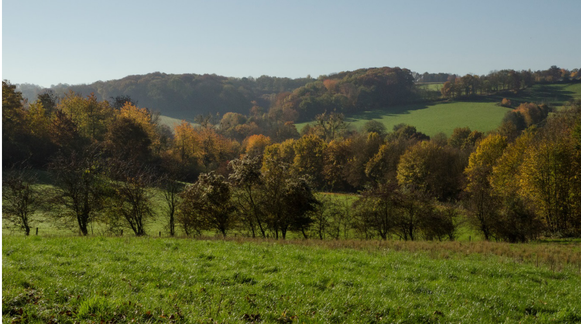
Hellinggraslanden tussen Slenaken en Beutenaken.

Bij het onderhouden van het lokale netwerk hebben de bestaande sociale netwerken en relaties grote invloed. De afgelopen periode is voor de schaapskooi veel energie gaan zitten – ook bij betrokken vrijwilligers – in het omgaan met conflictsituaties die waren ontstaan als gevolg van belangentegenstellingen rond het grondgebruik in het Gulpdal. Conflictsituaties zijn inherent aan de belangentegenstellingen die kunnen voortvloeien uit de omgang met collectieve goederen, en reden temeer voor goede samenwerking en het maken van afspraken (Ostrom, 2005, 2009). Het is bovendien van groot belang dat Staatsbosbeheer duidelijkheid schept over het Gulpdal.