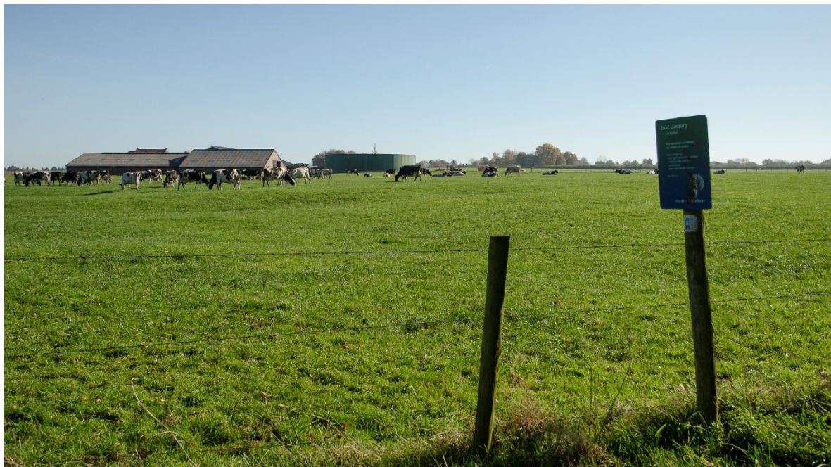
Melkveehouderijen op het plateau hebben ook interesse in de graslanden op de hellingen.

Het beheer van de graslanden in het Gulpdal heeft iets weg van een klassiek duel tussen landbouw en natuur. Daarbij zijn de percelen tussen het beekdal en de heuveltop in trek bij zowel rundvee- en melkveehouders als herders. Onder andere door een ongelijke behandeling binnen de kaders van het Europese landbouwbeleid is de concurrentiekracht van herders in Nederland veel lager dan die van de rundvee- en melkveehouders. De herders vallen met hun heideterreinen onder het natuurbeleid en kunnen daar geen beroep doen op de relatief hoge vaste hectarebetaling uit de eerste pijler van het GLB. In de plaats daarvan zijn ze er aangewezen op een premie per ooi, die is gebaseerd op intensief graslandbeheer met schapen en per hectare omgerekend veel lager uitpakt. En hoewel de natuurlijke graslanden in het Gulpdal vanaf 2016 wel onder het eerste pijler-regime vallen, ondervindt het bedrijf VOF Mergelland op bedrijfsniveau toch nadelen van de ongelijke behandeling tussen herders en veehouders. De schaapskooi Mergelland beheert immers ook de Brunsummerheide. Bovendien vallen voor rundvee- en melkveehouders na de afschaffing van de melkquota met de relatief lage pacht van natuurterreinen grote voordelen te behalen met verdeling van de mestrechten binnen hun bedrijf. Als alleen naar het financiële bod wordt gekeken bij het uitgeven van grond, zullen de herders daarom voorlopig elk duel verliezen.