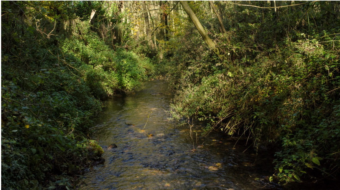
De Gulp ter hoogte van Beutenaken.