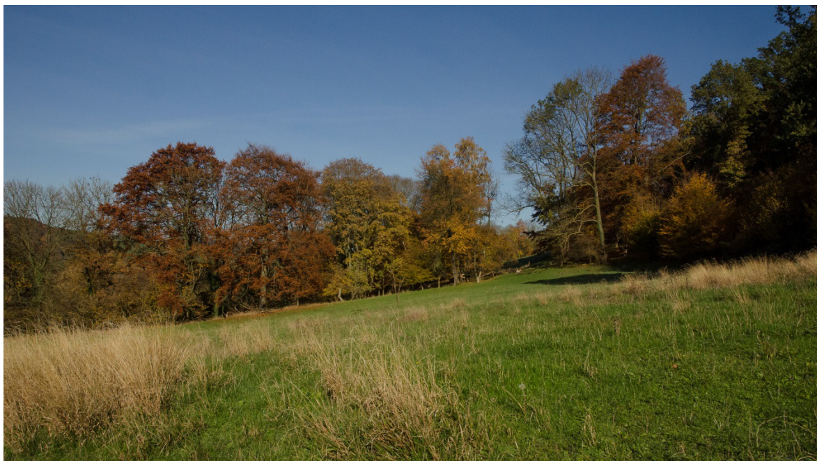
Hellinggrasland tussen Slenaken en Beutenaken.

De waardering die partijen voor het landschap van Heuvelland hebben, betekent niet automatisch dat het ook eenvoudig is hierover een nieuw sociaal contract aan te gaan met een onvoorwaardelijke betaling aan degenen die het landschap produceren. Hiervoor zijn meerdere redenen aan te geven. Dat begint al met de eerste vraag die we voor deze studie hebben gesteld.