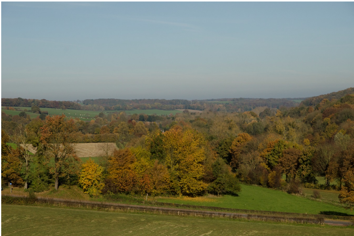
Het Gulpdal, gezien vanuit het zuiden.

Collectieve goederen vertegenwoordigen met elkaar een kolossaal vermogen. In een spraakmakend artikel in Nature begrootten Costanza et al. (1997) de totale waarde van ecosysteemdiensten en het natuurlijke kapitaal op minimaal 33 biljoen dollar per jaar, ofwel bijna tweemaal de totale jaarlijkse wereldproductie. Een groot probleem van dit collectieve vermogen is echter dat het nagenoeg geen inkomen genereert, althans geen collectief inkomen. Het ontbreken van mechanismen (of instituties) om dit vermogen te gelde te maken, leidt onder andere tot problemen met de financiering van collectieve goederen zoals het landschap van Heuvelland.