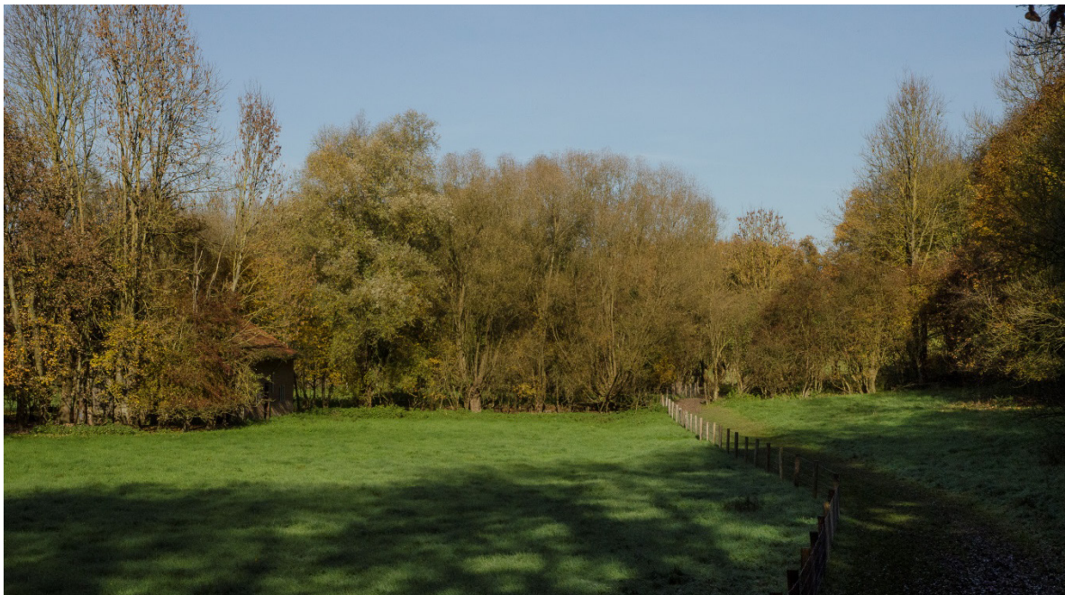
Graslandje in het dal ten hoogte van Beutenaken.

Voor de kudde in het Gulpdal zou het bovenstaande goed nieuws kunnen zijn als hierover met SBB goede afspraken worden gemaakt. De SVNL-vergoeding voor droog schraalgrasland bedraagt in 2015 circa € 563/ha en dat is ruim € 300 meer dan voor normaal kruiden- en faunarijck grasland. Samen met het toekomstige pijler 1-geld komt zo per hectare bijna € 930 beschikbaar voor het beheer. Dat is voldoende om er de pacht mee te betalen en een groot deel van het exploitatietekort op te heffen wanneer het huidige beheer op de kalkhellingen kan worden uitgebreid naar 40 hectare.