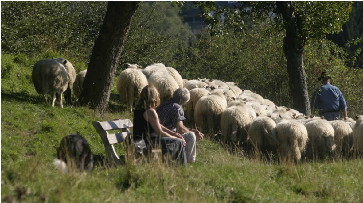
Toeristen genieten van de kudde.

In dit hoofdstuk introduceren wij een aantal uitgangspunten en concepten die onze aanpak hebben gestuurd, inclusief de manier waarop wij oplossingsrichtingen hebben gezocht. Zo heeft het concept 'ecosysteemdiensten' (2.1) onze zoektocht naar belanghebbenden ondersteund. Waarom die belanghebbenden niet allemaal betalende klant zijn van de kudde, hebben wij geprobeerd te begrijpen met behulp van de concepten 'collectieve goederen' en 'marktfalen' (2.2 en 2.3). Oplossingsrichtingen hebben wij gezocht in het organiseren van samenwerking en afspraken met behulp van het concept 'sociaal contract' en speltheorie (2.4 en 2.5). Een goed begrip van deze uitgangspunten en concepten helpt de lezer onze bevindingen en analyse in de hoofdstukken hierna te begrijpen.