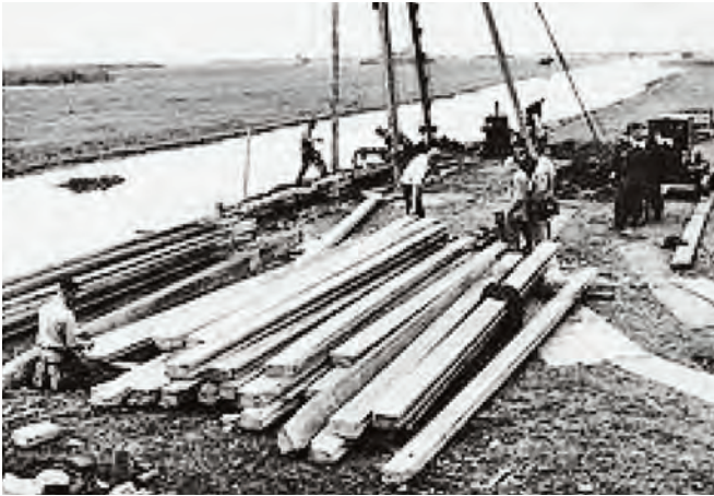
Afbeelding 4: Voorbereidingen voor graafwerk in en rondom 'het Gat van Wormer'