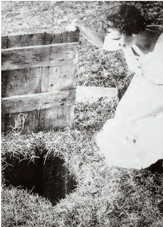
Afbeelding 2: Een buurtbewoonster bekijkt het 'Gat van Wormer' in september 1959