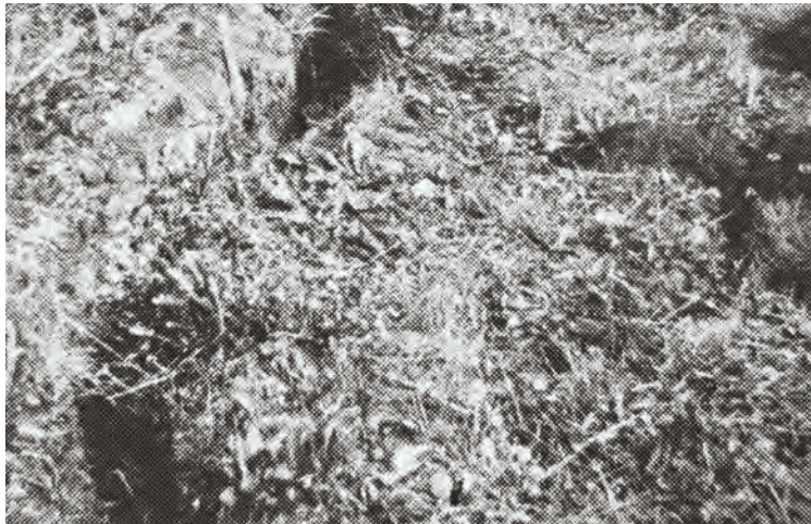
Afbeelding 11: Wijd openstaande veenscheur in zeggeveen (foto: Veenenbos, 1950)

Veenenbos (1950) heeft uitvoerig onderzoek gedaan naar het ontstaan van scheurvorming in veengronden. Hierbij bleek dat verdroging op zeggeveen veel ernstiger is dan op veenmosveen. Vandaar dat juist in de petgaten met zeggeveen scheurvorming in droge perioden optreedt. De horizontale inkrimping begint onder de bovengrond en later trekken de scheuren geheel tot aan het maaiveld open (afbeelding 11). Door daling van de grondwaterstand droogt behalve het bovenste veenpakket ook de daarop rustende minerale bovengrond sterk in, vooral een dunne bovengrond. De scheuren leveren gevaar op voor de weidende dieren. Veenenbos meldde dat zelfs een boer, hoewel beter bedacht op de gevaren dan wie ook, tot aan zijn oksels in de grond verdween toen hij door de grasmat zakte.