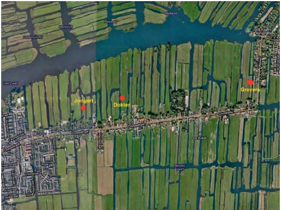
Afbeelding 1: Ligging van 'het Gat van Wormer' en de andere twee gaten in het plaatselijk vervingende weidelandschap

De trekgraten die ontstonden bij latere vervingen zijn breed en diep. Het veen werd toen tot aan de oude zeelei op circa 3 meter diepte weggebaggerd. Er bleef wat slappe bagger en verslagen veen achter. Door de groei van waterplanten en de opeenhoping van bagger werden ook deze trekgraten na jaren weer zo ondiep dat er opnieuw riet en lisdodde konden groeien en verlanding plaats vond. Na verloop van tijd groeiden er ook andere planten, zoals zeggesoorten en veenmossen, zodat alle overgangen tussen deze vegetaties bij de meeste vervingende percelen voorkomen. Naast vrijwel geheel vergraven en weer verlande percelen, vindt men ook veel percelen die slechts ten dele vergraven zijn. Door deze 'wilde' vervingen ontstond een landschap bestaande uit veel brede sloten, petgaten in allerlei stadia van verlanding en niet of gedeeltelijk afgegraven veengedeelten. Dit kan worden aangetroffen bij Landsmeer, Krommenie, ten zuiden van Wormerveer, in het centrum van de polder Wormer, Jisp en Neck, in het oostelijk deel van de Eilandspolder, in de polders Westzaan en Oostzaan en in het westen van Waterland (Pons en Kloosterhuis, 1955; Pons e.a., 1960; Mulder e.a., 1978).