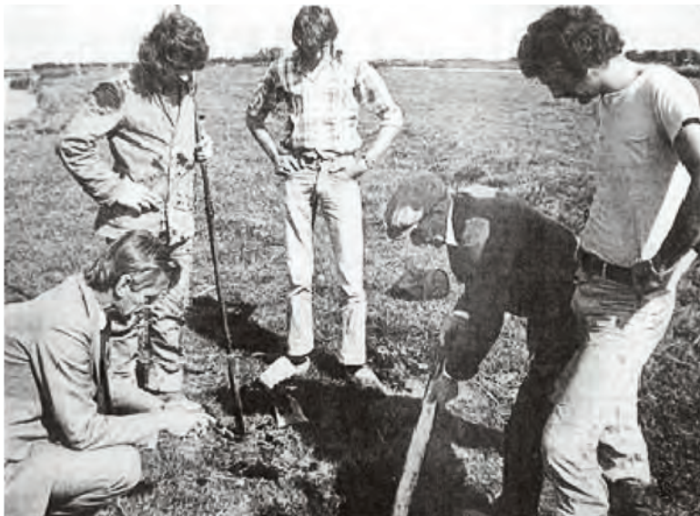
Afbeelding 8: Dokter toont de geologen hoe diep het gat in zijn land is

Op verzoek van de gemeente deed de Rijks Geologische Dienst een onderzoek naar de bodemopbouw in en rondom het gat (afbeelding 8). De heren Blokzijl en La Fleur boorden tot een diepte van 10 meter. Overal rond het gat vonden ze 3 meter veen, maar de hoeveelheid veen die in het gat zelf had gezeten vonden ze niet terug. De boorbeschrijvingen werden geïnterpreteerd door Prof. F.F.F.E. Van Rummelen, die tot de conclusie kwam dat het gat het gevolg was van menselijk ingrijpen. Over zijn opvatting gaf hij op 24 oktober 1975 in 'Ons Huis' in Wormer een toelichting (Korver, 1975; NRC, 1975; Roos, 1975). Volgens hem was het gat ontstaan door het winnen van vruchtbare zeeklei uit de ondergrond die als bemesting werd gebruikt.