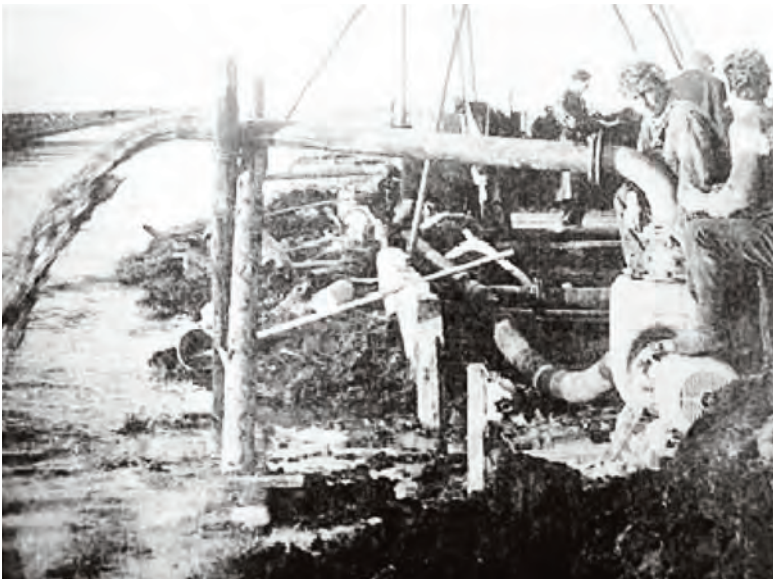
Afbeelding 7: Opwellend water en instortingen bemoeilijken het onderzoek

Kapitein Blommaart was echter niet tevreden met de stopgezette operatie en kwam met het voorstel een internationaal fonds op te zetten om verder onderzoek te bekostigen. Amerika zag wel wat in de mogelijke vondst van een Spoetnik, maar het ministerie van defensie zag niets in buitenlandse pottenkijkers en verwierp het voorstel. Dat betekende de doodsteek van 'het Gat van Wormer'. Enkele jaren later liet Blommaart in een radio-uitzending van de VARA nogmaals weten graag weer in Wormer aan het graven te gaan (De Typhoon, 1973). De inmiddels majoor geworden Blommaart probeerde in 1974 weer van Amerikaanse zijde geld los te krijgen om het onderzoek met moderne en betere middelen dan in 1959 te hervatten (Grandiek, 1974). Zijn overredingskracht was echter niet groot genoeg voor toestemming tot voltooiing van zijn speurwerk in 'het Gat van Wormer'.