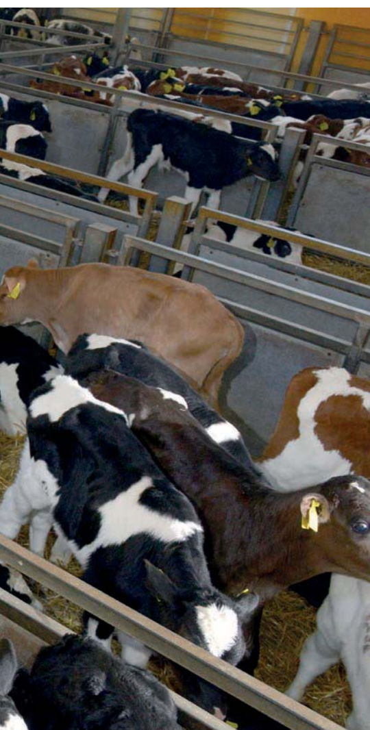
Alle kalveren worden voortaan gevolgd via een 'kalfvolgsysteem'

Bovendien, zo meent Eggens, kan het antibioticagebruik op de kalverhouderij ook fors omlaag als de kalveren vitaler en gezonder arriveren. 'De kalverhouderij is eigenlijk een onderdeel van de melkveehouderij. Ik zie die als één geheel. Uiteindelijk gaat het om diergezondheid en antibioticareductie. Beide sectoren hebben daar een gezamenlijke verantwoordelijkheid.' |