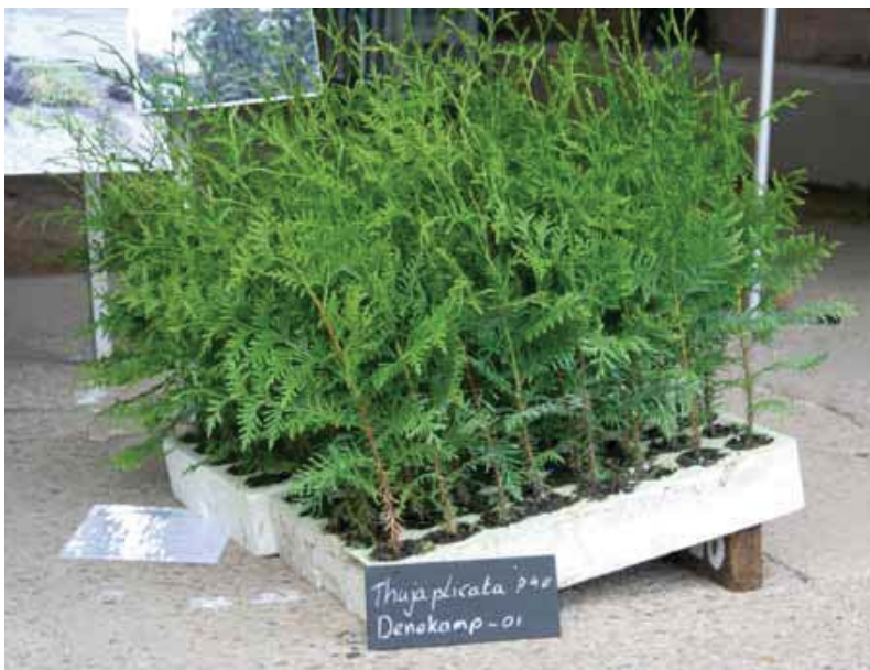
Thuja P40 in de groeiplaat.

De hergroei van de pluggen is beter dan van naaktwortelig materiaal. Bij naaktwortelig zien we dat de planten in het eerste jaar veelal een korte nieuwe scheut vormen als gevolg van de plantschok, maar pluggen groeien gelijk door en hebben een meer normale scheutlengte. Vooral bij de douglas is dat opvallend. Wildschade in het eerste seizoen is nauwelijks geconstateerd.