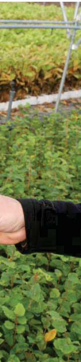
Beuk in plug.

Voorafgaand aan een plantklus wordt het takhout veelal geklepeld of als biomassa afgevoerd. In de praktijk blijkt dat, als er sprake is van veel takhout, er een goed plantresultaat wordt behaald als het takhout van de kapvlakte wordt verwijderd. "Kraanschoon" is een veelgebruikte vakterm wat inhoudt dat het takhout dat met een bosbouwkraan beetgepakt kan worden van de kapvlakte wordt verwijderd. Wat overblijft zijn de fijnere takken en dan blijkt een kapvlakte geschikt voor de inzet van machines zoals de Disc-trencher, zie foto. Grover takhout kan de Disc-trencher en andere type machines negatief beïnvloeden. Voordeel van klepelen en achterlaten van het tak- en tophout is dat dit beter is voor de mineralenhuishouding en de gezondheid van de bosbodem.