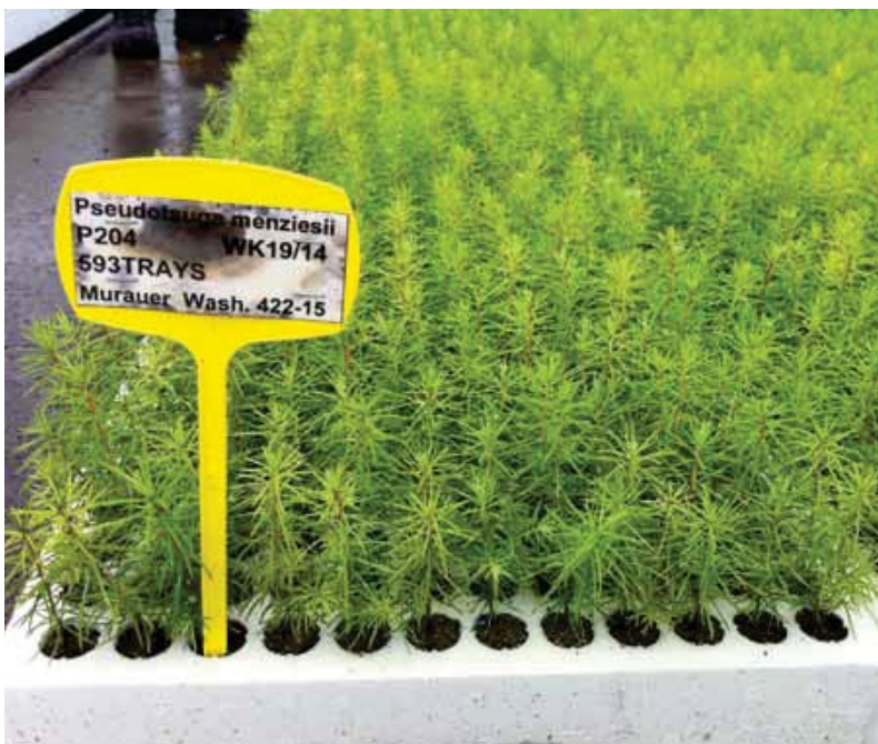
Pluggen in de kas Douglaspluggen in de kas enkele weken oud.

Het planttijdstip mei/juni is gunstiger in verband met vrachtschade door reeën. Geconstateerd is dat in het jaar van aanplant nauwelijks wildschade voorkomt. Kennelijk is het voedselaanbod in deze periode, vergeleken met het vroege voorjaar, zo groot en divers dat de aantrekkingskracht van het plugplantsoen minder is. In het tweede jaar na aanplant zijn er geen verschillen geconstateerd.