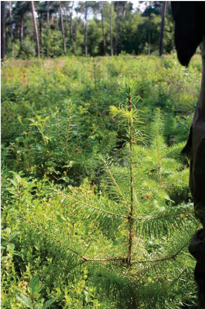
Scheut douglasplug in eerste groeiseizoen.

Maximale plantmaat voor pluggen. Plugplantsoen moet niet te groot en te betakt zijn. De plant moet door de plantbuis kunnen zakken en daarbij