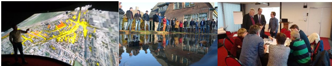
Afbeelding 1. Impressies 3 masterclasses, ‘willen, weten, werken’. Met 1a: 3D-visualisatie wateroverlast, 1b:simulatie infiltratie in verharding (midden) en 1c: workshops voor detaillering oplossingen.

In de volgende paragrafen worden de sessies toegelicht en de resultaten gepresenteerd.