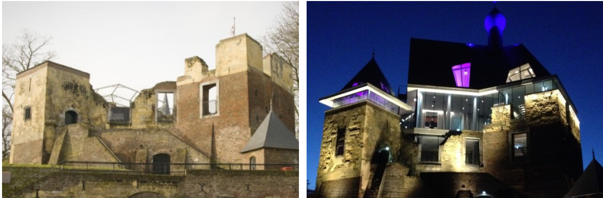
Figuur 01 Kasteel de Keverberg, Kessel. De plek waar Karim van Knippenberg samen met de VKKL en Ruimtevolk een bijeenkomst organiseerde over erfgoed en burgerinitiatieven. Het kasteel is door actieve inzet van burgers in goed samenwerking met de overheid getransformeerd van een lelijke plek midden in het dorp tot een publiekstrekker.

Gebruikte onderzoeksmethodiek: literatuuronderzoek, media analyse, (veldwerk) interviews, workshop samen met VKKL & Ruimtevolk 3 , https://ruimtevolk.nl/2015/10/20/erfgoed-als-vliegwiel-voor-dorpsontwikkeling/