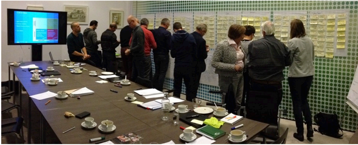
Figuur 03 De groep deelnemers aan de creatieve sessie voor de wand met 232 ideeën waarbij ieder voor zich probeert de meest aansprekende ideeën te benoemen.