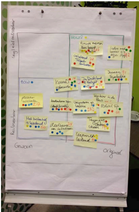
Figuur 04 De circa 15 ideeën die het meest scoorden na de prioriteringsronde gepositioneerd in een matrix.

NOW (ideeën die snel door te voeren zijn, laag risico, veel draagvlak, weinig inspanning)