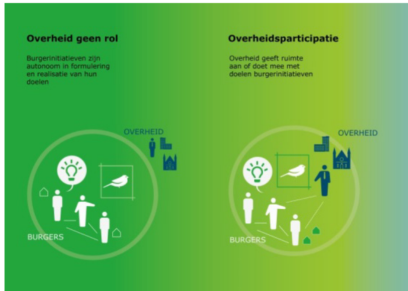
Figuur 02 Overheidsrollen bij realisatie publieke waarden in relatie tot burgers en hun initiatieven