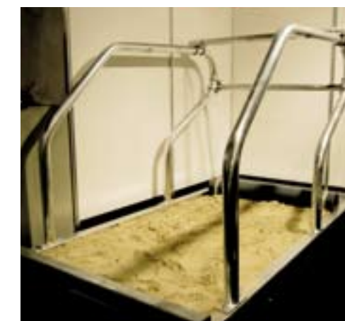
Een oude R-box doet zijn werk nog prima in zandboxen.