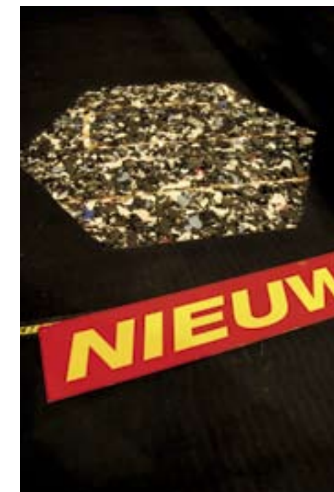
De Boer stalinrichting bedacht een ligmatras met waterkoeling.

In de vulling van de ligboxmatrassen freesde de stalinrichter banen waardoor een waterleiding loopt. Laat je daardoor koud water stromen, dan zou het ligbed en dus ook de koe die er op ligt afkoelen. Zou, want het idee is nog niet echt praktijkrijp of te koop. De stalinrichter wilde tijdens de Landbouwwerktuigenbeurs van de bezoekers horen wat zij van dat idee vonden. De Boer noemt de vinding 'een mooie aanvulling op de ventilatie'.