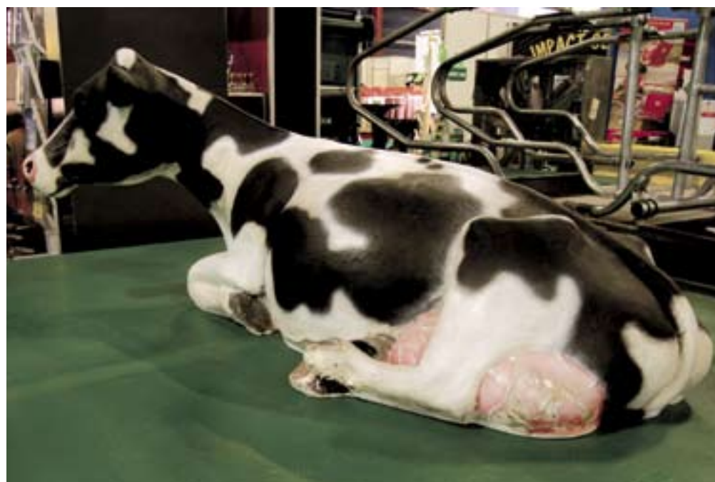
Brouwers' mat voor de afkalfstal.

levert, heeft namelijk de Outback S-light in het programma. Het apparaatje kost 1.650 euro en is snel te monteren. Je moet er een antenne met magneetvoetje voor op de trekker plaatsen. En je moet het kastje met een rij lampjes die de rijrichting aangeven, aansluiten op de elektriciteit. Vervolgens stel je een A-B-lijn in en de werkbreedte van de maaier, schudder of kunstmeststrooier, en het apparaat berekent de rijpaden. Zit daar een bocht in? Ook dan zorgt het kastje dat je parallel aan de eerste werkgang kunt blijven rijden. Je moet daarvoor natuurlijk wel de aanwijzingen op het kastje blijven volgen. Uiteindelijk levert dat een nauwkeurigheid van 15 tot 30 cm op. ■