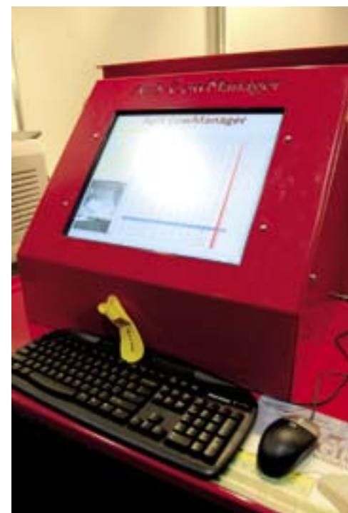
De Agis Cowmanager met een zogenoemd Fastfocus Sensor.

Stalinrichter De Boer liet zien hoe je hitte-stress bij de koeien zou kunnen verminderen.