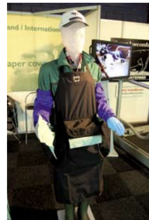
Het BUC-schort herbergt tweehonderd uierdoekjes.