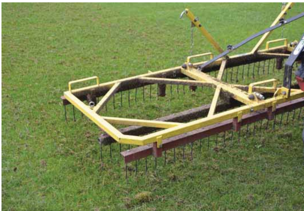
Butters zelfontworpen kriebel-eg.

Onlangs besloten de gemeenten Purmerend en Beemster het veldonderhoud samen te voegen. Sinds enige tijd worden de velden van de laatstgenoemde gemeente daarom onderhouden door Purmerend. Butter is daarmee verantwoordelijk voor het onderhoud van zo'n veertig velden.