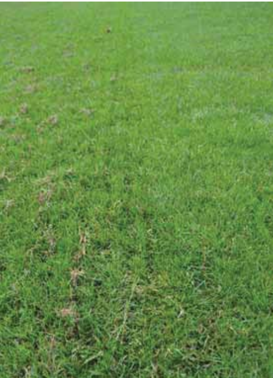
Het veld vóór en na een rit op de kriebel-eg.

te Haarlem, toonden interesse en kwamen langs om zijn eg te bekijken. Allen gaven aan enthousiast te zijn, maar tot op heden heeft niemand de methode daadwerkelijk toegepast. Butter: 'Het is ook niet mijn taak om mensen te overtuigen. Ik wil alleen laten zien wat mogelijk is.'