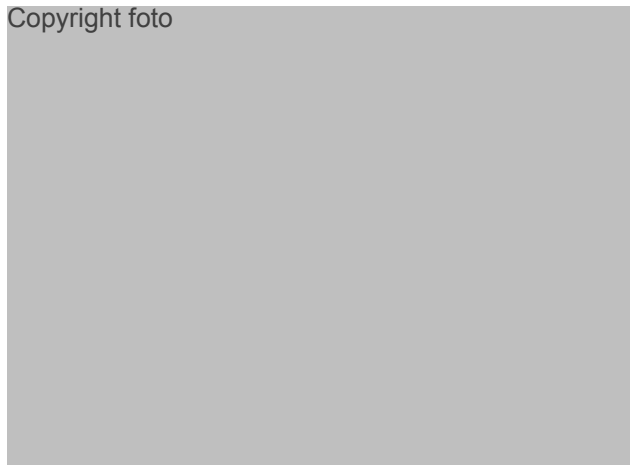
Op de plaats van de oude sleufsilo's wordt volgend jaar de nieuwe stal gezet. Een sleufsilo is tijdelijk in gebruik als extra mestopslag.

Voer aanschuiven gaat vlot, zo. De smalle voergang in de uit 1970 daterende stal is ingestraat met trottoirtegels.