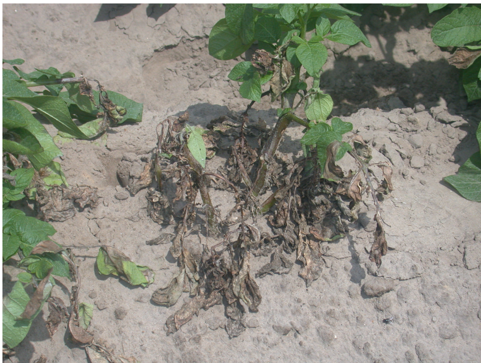
Foto 2. Centrale plant van een hardje aangetast vanuit een infectie, die kort na opkomst moet zijn ontstaan. Let op de al vroegtijdig, kort na opkomst begonnen aantasting. De moederknol van deze plant was vrij van aardappelziekte.