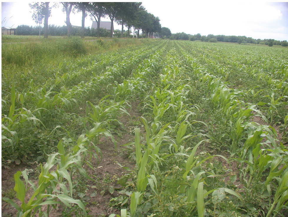
Foto 4. Maïsveld met zeer veel aardappelopslag in de buurt van Ospeldijk. Alle opslagplanten waren in ernstige mate aangetast door (sporulerende) Phytophthora.