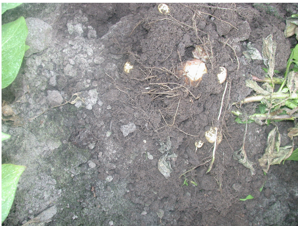
Foto 3. Centrale plant met zieke moederknol. Gezien het ondiepe poten en de aanwezig jong aangetaste en reeds dode scheutjes is niet met zekerheid te stellen of de plant via de moederknol is ziek geworden of de moederknol via de reeds vroeg aangetaste scheutjes.