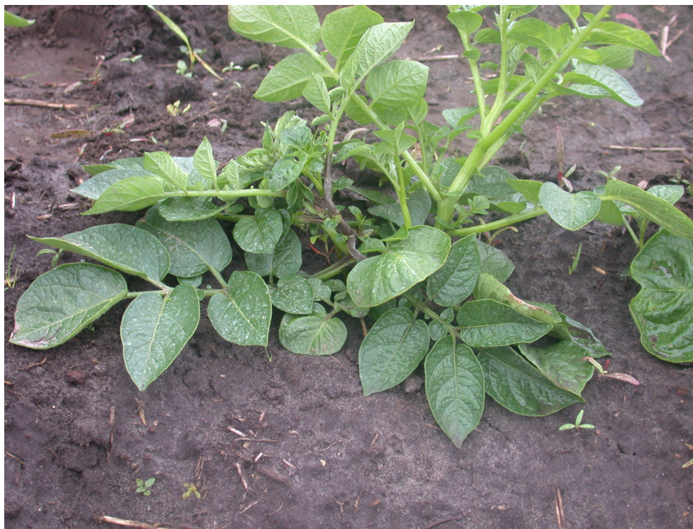
Foto 1. Vroeg secundaire aantasting van cv. Seresta in de omgeving van 't Haantje. Infectie van een enkele stengel van ten minste 3 weken oud met weinig uitbreiding binnen de plant. De lengtegroei is sterk achtergebleven, wat voor dit geval een aantasting suggereert die tussen drie tot vier weken geleden begonnen is.