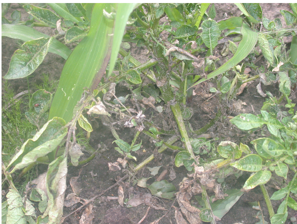
Foto 5. Phytophthora-haard in maïsveld te Ospeldijk, die reeds geruime tijd functioneel is geweest gezien de leeftijd van de maïs en van de aardappelplanten, de uitgebreidheid van de aantasting en het grote aantal leeftijdklassen van lesies.