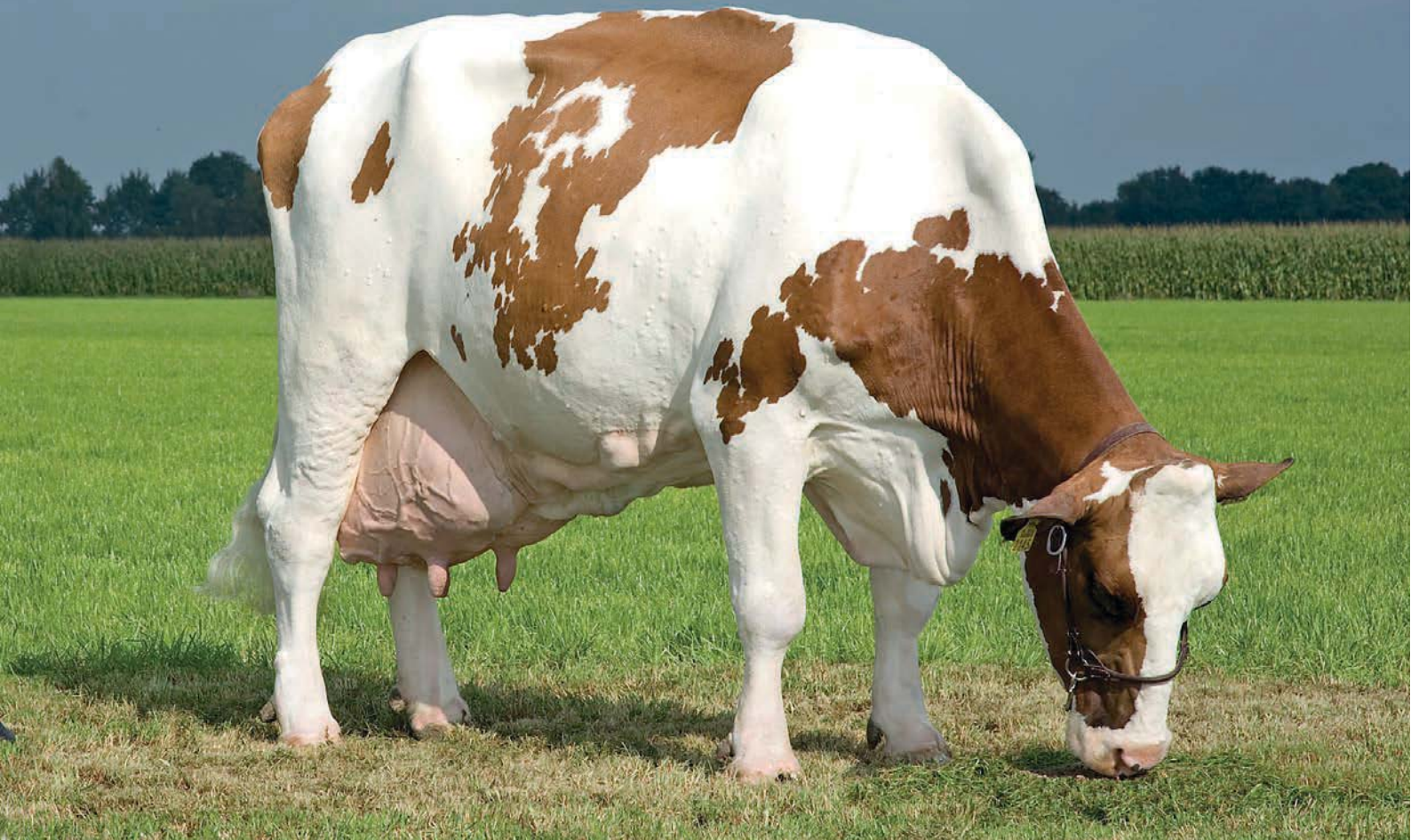
Martha 288, moeder van Marcello, combineert hoge producties met 91 puntenexterieur