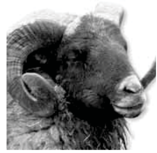
Fabrwin Alburg Kampioen (A + S) Heidschnucker Gilde

De schaapskudde is hierin de onmisbare schakel tussen heide, (reservaat-)akker en hooiland; tussen landschapsecologie, cultuurhistorie en economie. Kortom: exit grote grazers, welkom heideboerderij, waarin herders en schapen een centrale rol spelen.