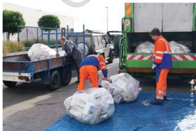
De verpakkingen die je bij 'NBGM' geplaatst hebt, kan je iedere twee jaar bij AgriRecover gratis bezorgen.

Zorg er voor dat de stockage van fytoproducten voldoet aan de wettelijke basisvereisten waar het Federaal Agentschap voor de