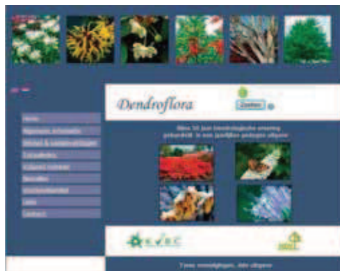
9. Website van dendroflora: www.dendroflora.nl .