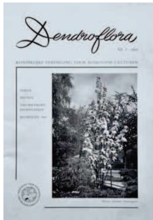
1. De allereerste; de omslag was nog in zwart-wit.

Dendroflora 2 werd dan ook direct dikker, al bleef