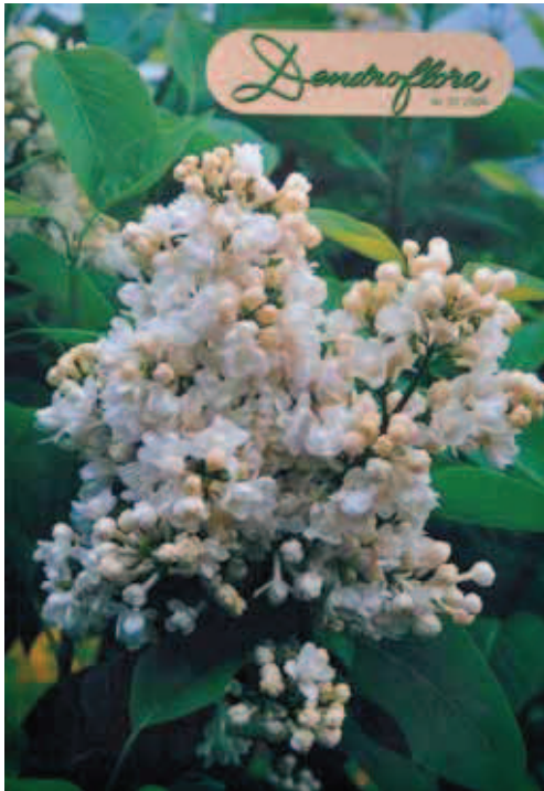
8. Dendroflora 37; de eerste echt fullcolour uitgave.

susaanbod. Even suggereerde hij nog dat echtgenote Nel die cursus maar moest doen, maar dat was niet de bedoeling.