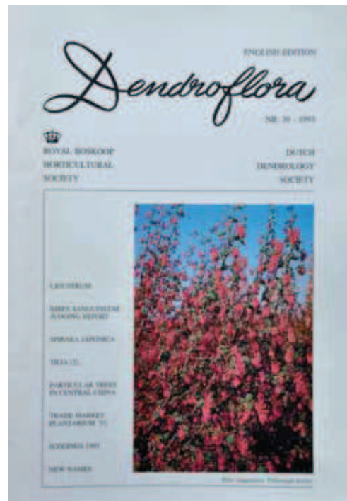
5. De Engelse editie van Dendroflora 30; het bleek geen succes.

Dendroflora werd door de KVBC ook naar diverse buitenlandse relaties en tuinen gestuurd, maar het effect daarvan was gering, omdat het in het Nederlands was. Overwogen werd om