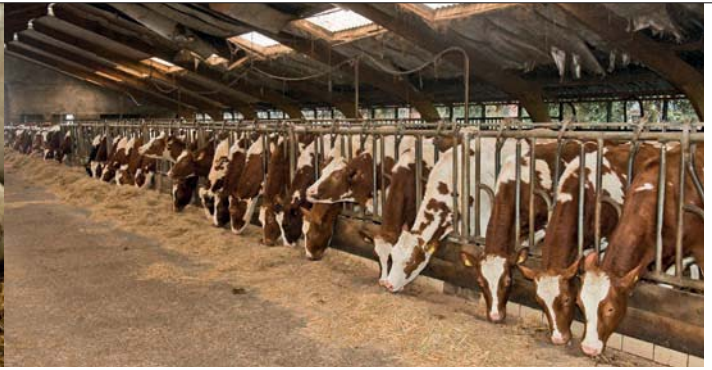
De jonge kalveren gaan na enkele weken naar de jongveeopfokker In de oude ligboxenstal uit 1972 staat nu het oudere jongvee