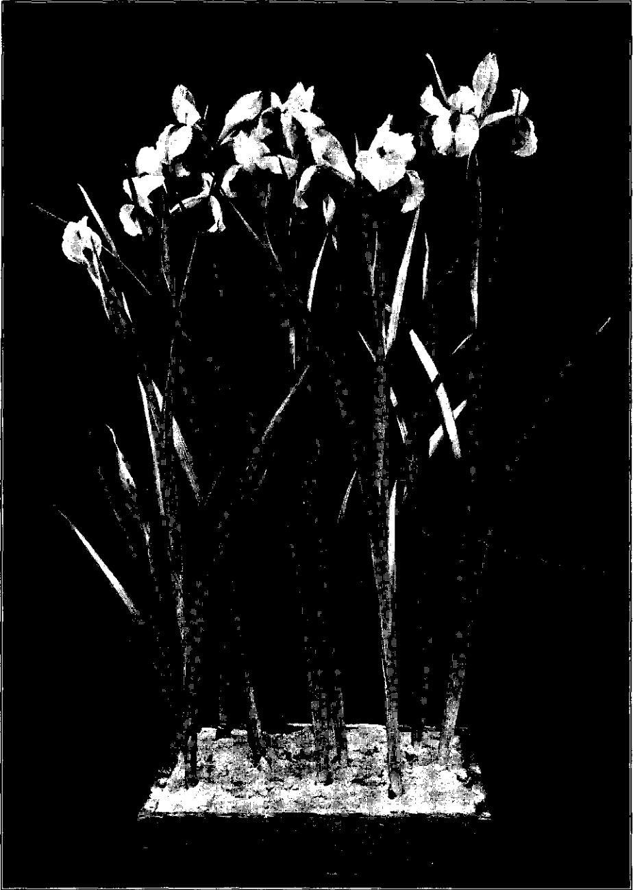
Fig. 1. Iris tingitana op 1 Dec. 1933 in bloei komend na behandeling met 9° C.

Proceedings Royal Acad. Amsterdam. Vol. XXXVII. 1934.