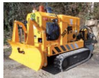
Je kunt de Predator onder meer uitrusten met een schuifblad of klepelmaaier.