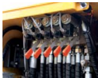
De accu van de afstandbediening leeg? Dan kun je de machine nog met hendels bedienen.