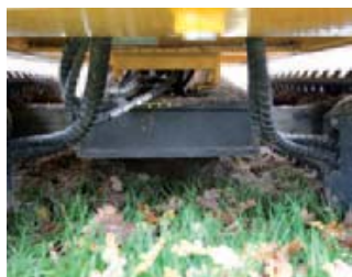
De afstandsbediening is van Scanreco en die werkt erg gebruiksvriendelijk.