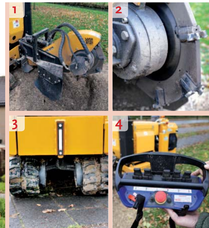
Bij de foto's 1 - 4

P redator startte in 2000 met de constructie van houtversnipperaars in het Verenigd Koninkrijk. Drie jaar later volgde de eerste stobbenfrees. Ufkes Greentec uit Drachten haalt de machines sinds 2004 naar Nederland. Het stobbenfreesenprogramma van Predator telt inmiddels vier modellen met motorvermogens van 20,5 tot 48 kW (28 tot 65 pk). Allemaal staan ze op een rupsonderstel. Daar staat de X voor. De RX-modellen worden radiografisch bestuurd. Op de kleinere modellen monteert de fabrikant een benzinemotor van Honda, Kohler of Lombardini. De twee zwaarste modellen hebben standaard een Hatz-dieselmotor. Importeur Ufkes verkoopt in Nederland vooral het model 50RX. De Predator 50RX is het enige model met een variabele spoorbreedte. Met een druk op de knop is die instelbaar van 77,5 tot 117,5 cm.