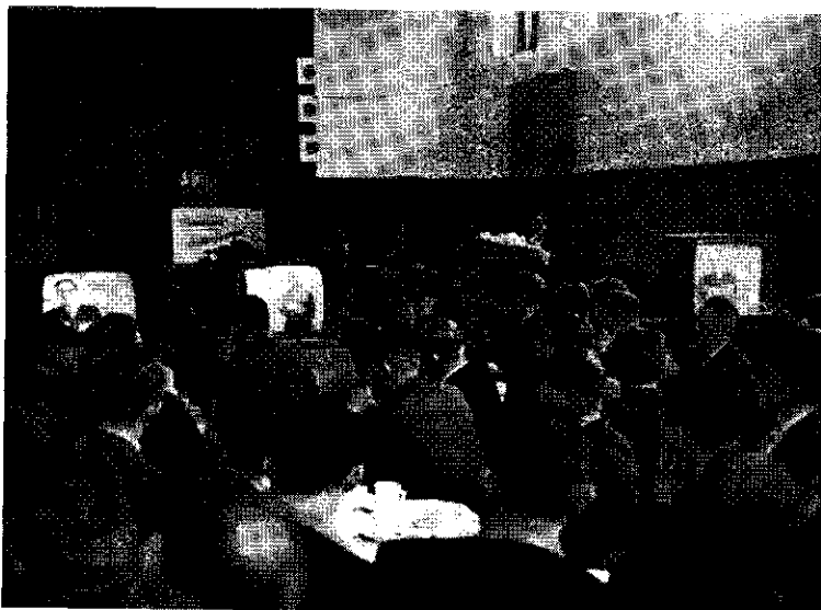
EEN KIKJE IN DE TELEVISIEZAAL

Organisatoren, sprekers en bezoekers van een bijeenkomst zijn allemaal mensen met een meer of minder groot aanpassingsvermogen. Men kan zich voorstellen dat de organisatoren van een voorlichtingsdag, waar een breed onderwerp wordt behandeld, een groot aantal sprekers vragen, die stuk voor stuk sterk gespecialiseerd zijn. De organisatoren zullen dan hun programma gaan aanpassen aan het grote aantal sprekers. De sprekers kunnen hun inleidingen gaan aanpassen bij de korte spreektijd en zo veel mogelijk inhaken op elkaar, zodat de inleidingen toch meer samenhang zullen gaan vertonen. En ten slotte kunnen de toehoorders bij het opstellen van hun vragen er rekening mee gaan houden dat er voor de discussie slechts een korte tijd beschikbaar is. Het grote aantal lezingen blijkt dan achteraf optimaal te zijn geweest. Maar het is evengoed denkbaar, dat één lezing met lichtbeelden 'smorgens en een hele middag voor de discussie, optimaal zou zijn. Het is dus niet uitgesloten, dat het optimale aantal lezingen op een bijeenkomst uiteenloopt van 1 tot bijvoorbeeld 6.