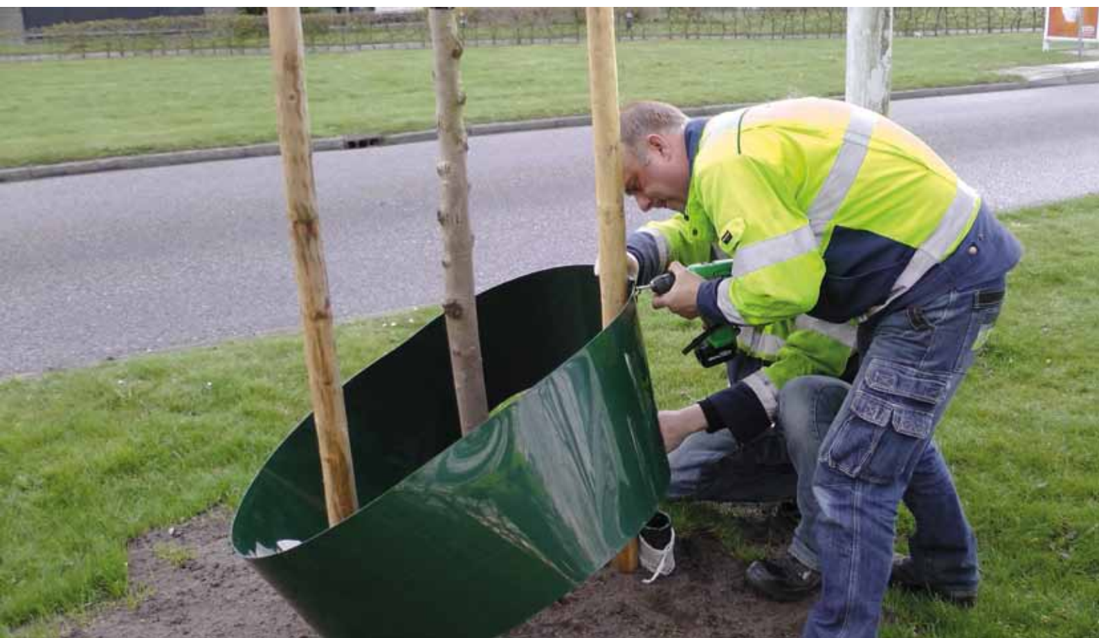
HDPE-gietrand is makkelijk te verwerken.

'We hebben voor deze gietranden gekozen omdat ze snel te plaatsen zijn en stevig zijn'