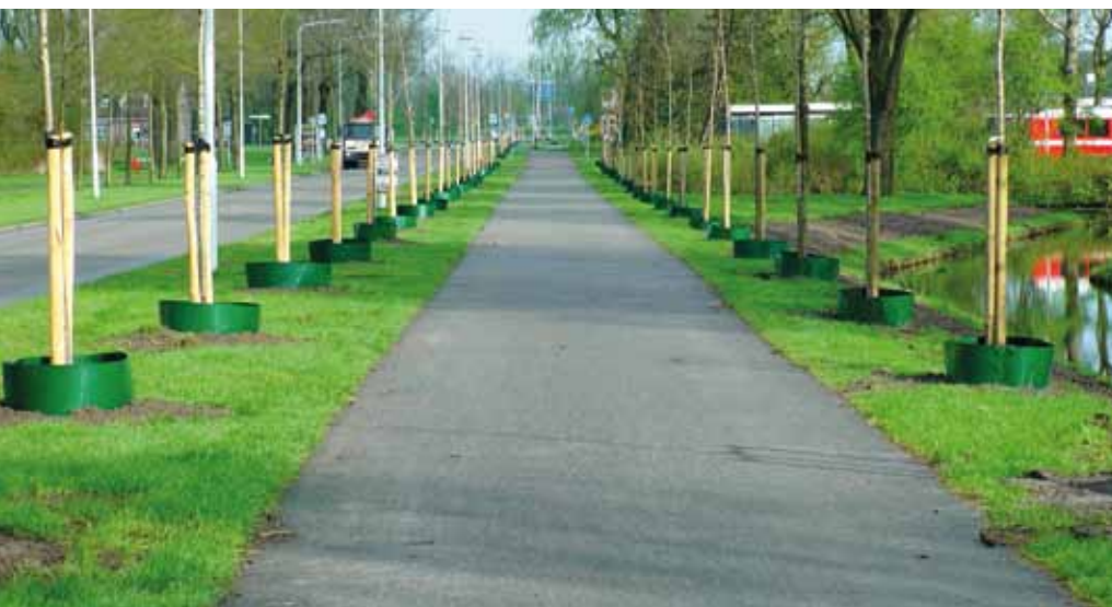
De gietranden in de gemeente Dongeradeel.

nieuwe gietranden hebben we het hele seizoen zonder problemen laten staan. Normaal gesproken konden we alle oude gietranden na een seizoen wel vervangen, maar dit maal waren er maar vijf kapot. Dat had andere oorzaken; waarschijnlijk is er een maaimachine tegenaan gereden.'