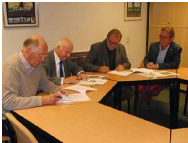
Ondertekening contract HGM - Stichting Capelse Golf 24 sept. 2015.