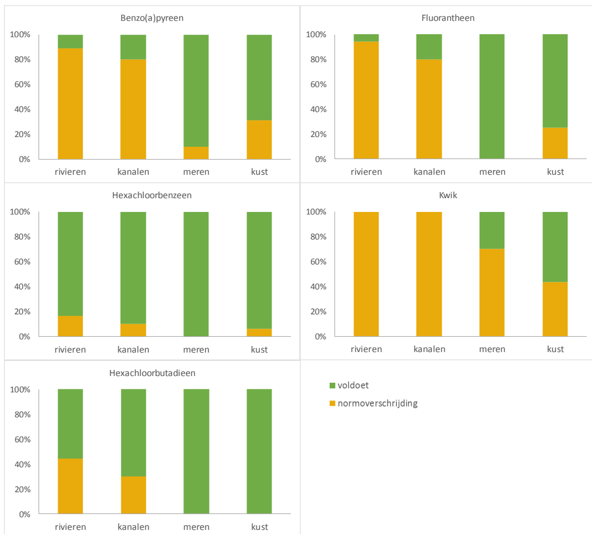
Figuur 4.2. Het aantal waterlichamen (%) met een normoverschrijding voor een van de genoemde stoffen met een biotnorm.

Dit inzicht in de normoverschrijdingen in oppervlaktewater ondersteunen daarmee de conclusie in §4.1 over de emissies dat een aanvullende monitoringsinspanning voor kanalen en zeker de meren meerwaarde heeft.