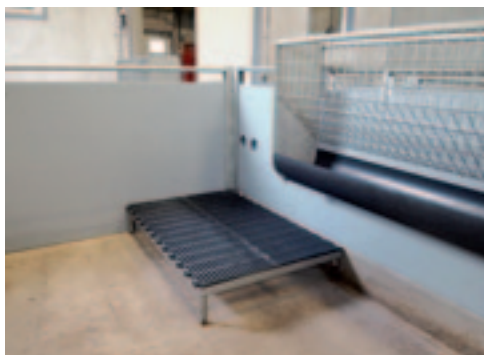
De lammeren staan op verhoogde roosters tijdens het drinken.