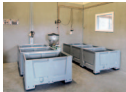
De bakken waarin de lammeren worden opgevangen en kunstbiest krijgen.