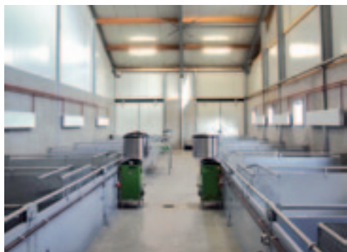
De lammerenafdeling. Achterin grote deuren, wat het uitmesten makkelijk maakt.