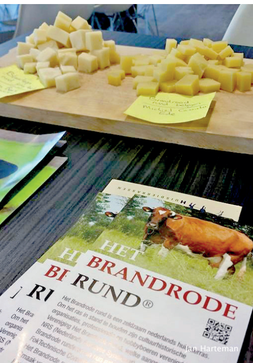
Er kon van alles geproefd worden zoals kaas van brandroden en blaarkoppen

liet zij zien dat er een groot verschil is tussen het aantal leden en het aantal actieve fokkers.