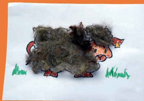
Schaapje met jas van wol

Kleed een schaap aan. Op de website staat een tekening van een schaap ( www.szh.nl op de kinderpagina). Je kunt de tekening downloaden en met wol het schaap een mooi jasje geven. Vraag wat wol van iemand in de buurt die schapen geschoren heeft. Dat kan bij een schaapskooi of een kinderboerderij. Met lijm kun je de wol in kleine bolletjes op het schaapje plakken. Met kleurpotlood kun je de omgeving van het schaapje verder inkleuren, zoals een mooi stralend zonnetje, of een paar mooie bloemen in de wei.