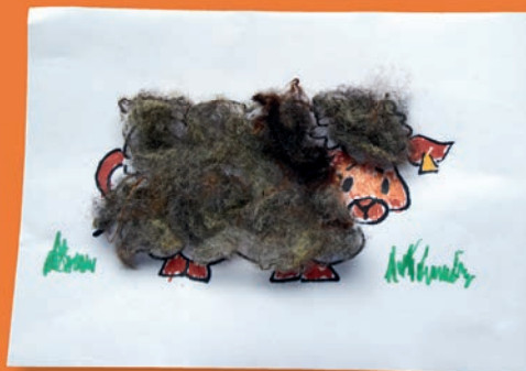
Schaapje met jas van wol

Kleed een schaap aan. Op de website staat een tekening van een schaap ( www.szh.nl op de kinderpagina). Je kunt de tekening downloaden en met wol het schaap een mooi jasje geven. Vraag wat wol van iemand in de buurt die schapen geschoren heeft. Dat kan bij een schaapskooi of een kinderboerderij. Met lijm kun je de wol in kleine bolletjes op het schaapje plakken. Met kleurpotlood kun je de omgeving van het schaapje verder inkleuren, zoals een mooi stralend zonnetje, of een paar mooie bloemen in de wei.