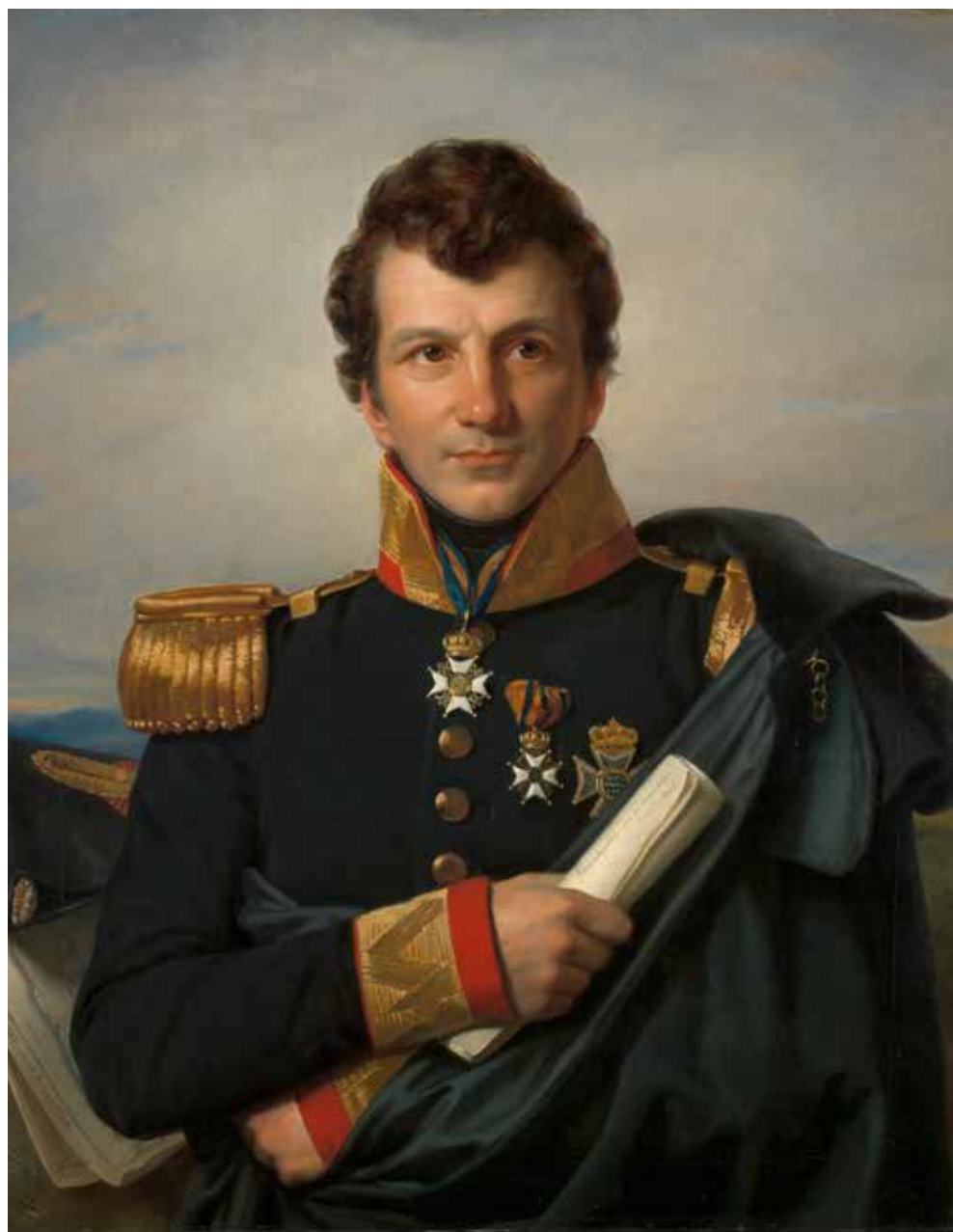
▲ Graaf Johannes van den Bosch (1780-1844), gouverneur-generaal van Nederlands-Indië, minister van koloniën. Cornelis Kruseman, 1829. Rijksmuseum Amsterdam.