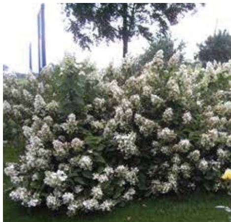
Pluimhortensia, Hydrangea paniculata

De 'gewone' boerenhortensia. Bij deze soort knipt u alleen de oude bloemen weg.