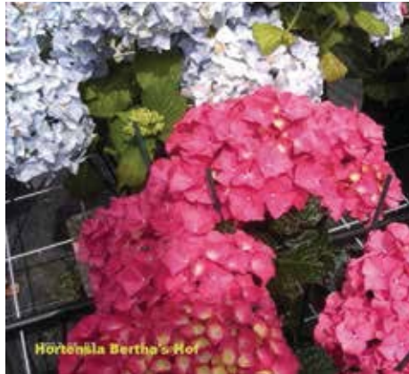
Hydrangea macrophylla 'Alpengluehen'

Op droge en warme zomerse dagen zullen deze hortensia's, net zoals het eenjarig plantgoed in de gemeentelijke bakken, moeten worden voorzien van water.