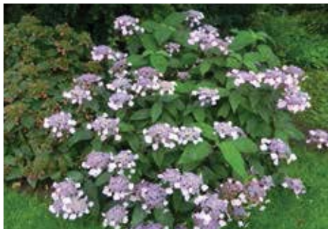
Hydrangea villosa 'Anthony Bullivant'