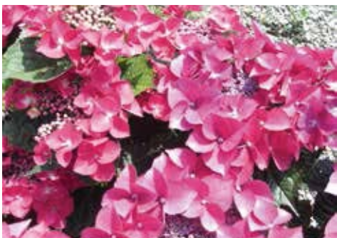
Schermbloemige hortensia 'Kardinal'

Voor echte beperking van de groei van hortensia's, pas je wortelsnoei toe. Met een scherpe schop moeten de wortels rondom de plant door gestoken worden. Hoe dicht bij de plant wordt gestoken, hoe meer de groei beperkt wordt. Maart en april zijn de beste maanden voor wortelsnoei.'