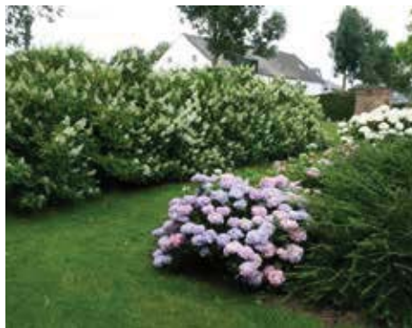
Links pluimhortensia's, rechts bolhortensia's. Uiterst rechts 'Annabelle'.