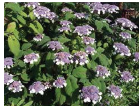
Hydrangea aspera 'Macrophylla'

Deze soort kan echter ook heel goed gesnoeid worden. Bij jaarlijkse snoei krijgt men elk jaar een struik van ongeveer een meter hoogte, die in de loop der tijd steeds meer pluimen zal geven. Met deze jaarlijkse snoei is de struik juist weer zeer geschikt voor laag blijvende perken. De soort staat ook bekend om de bestendigheid tegen uitlaatgassen en andere rookverontreiniging, wat hem geschikt maakt voor aanplanting in industrieterreinen, langs wegen en eventueel tussen parkeerplaatsen in woonwijken. De eerste drie jaar moet hij bewaterd worden, maar daarna kan hij zelf zijn water in de grond zoeken met beworteling tot een halve meter.