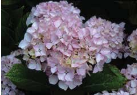
Hydrangea macrophylla 'Otaksa'

donkerrood en blijven tot diep in de herfst het aanzien waard. Vooral in kalkrijke grond zullen de bloemen roze worden. De plant zal op den duur niet hoger dan 1,25 m worden. Hij is goed winterhard.