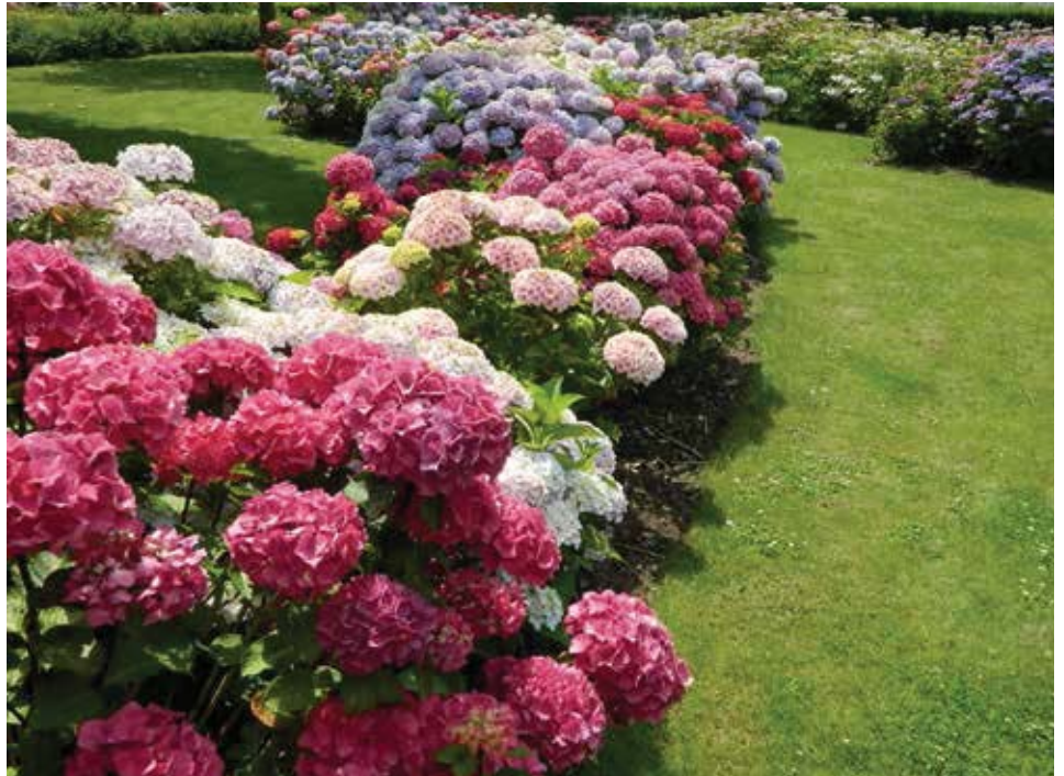
'Gewone' boerenhortensia, Hydrangea macrophylla .

De 'gewone' boerenhortensia. Bij deze soort knipt u alleen de oude bloemen weg.