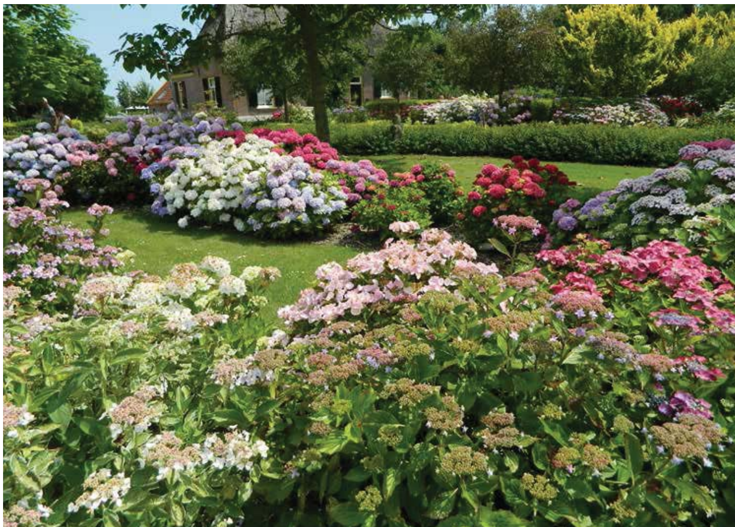
De hortensiatuin van Bertha's Hof

Hortensia heeft een, ten opzichte van andere soorten, erg afwijkend eikenbladachtig blad. De plant komt van oorsprong uit Noord Amerika. Het blad is circa 25 cm groot, fraai gevormd en krijgt een prachtige roodbruine herfstkleur. De bloei is van eind juli tot in september. De bloemen zijn pluimvormig, crème wit. De struiken worden op den duur zo'n 1,5 m hoog en breed.