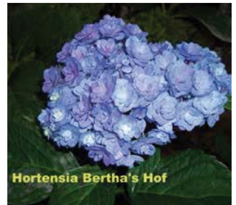
Hydrangea macrophylla 'Together'

Als de plant in kalkrijke grond staat, zal ze roze worden. De bloeitijd is juli – september. Hij is goed winterhard. De 'Mathilde Gütges' is een cultivar die in 1946 door August Steiniger, Duitsland, werd geïntroduceerd. Het is een kleine compacte struik die nauwelijks een meter haalt en is daarom bij uitstek geschikt voor de lager blijvende gemeenteparken.