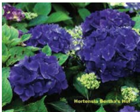
Hydrangea macrophylla 'Mathilde Gütges'

Het bijzondere van deze hortensia is dat de bloem ook in zure grond niet van kleur zal veranderen. De kleur blijft donkerroze tot rood. Het is een kleine compacte struik die na geruime tijd iets meer dan een meter haalt. Hij bloeit laat in het seizoen, van juli tot en met september en hij is goed winterhard.