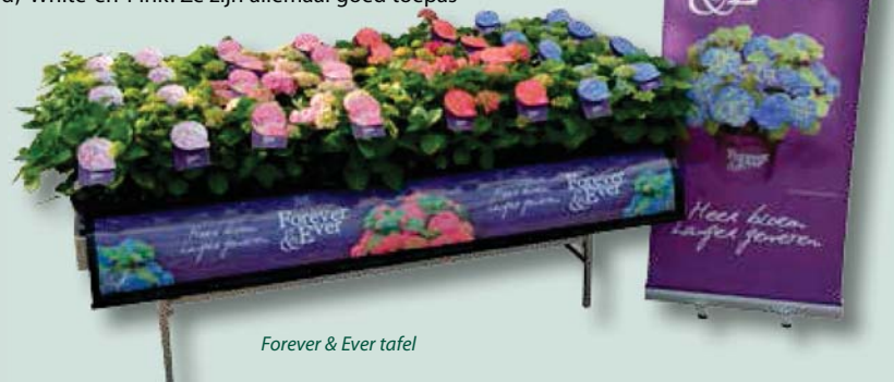
Forever & Ever tafel

baar in landscaping, gemakkelijk af te knippen en geven datzelfde jaar weer bloem, ook heel goed te combineren met heesters. Op klei doen zij het sowieso beter, maar op zand ook, omdat ze niet extreem groot worden. Daardoor gaan ze in de zomermaanden niet slap hangen. Ook op opgespoten zand kun je ze gerust toepassen, maar houd dan alleen het zoutgehalte goed in de gaten en voeg wat klei toe. We zijn een extra service aan het ontwikkelen: we gaan bij de hortensia de juiste grond leveren. Want met name bij 'Blue' bestaat soms het risico dat hij terug kan vallen naar roze.'