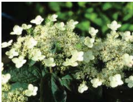
Hydrangea heteromalla 'Gidie'

Hydrangea villosa . De villosa wordt een grote struik, tot 2 m hoog. De bloeiwijze is zeer groot en de bloemen zijn schermvormig, waarbij de kleine fertiele bloempjes die het scherm vormen, lila of paars zijn. De steriele randbloemen zijn wit of roze. Het blad is smal en toegespitst, aan de onderkant enigszins viltig, de bovenkant wat borstelig behaard. Vroeger behoorde de villosa tot de aspera -soort. Er zijn dan ook verwante eigenschappen. Hij is geschikt voor parken omdat hij een wat verfijndere bloem heeft en redelijk terughoudend is in kleur. Een wat schaduwrijke plek is aan te bevelen.