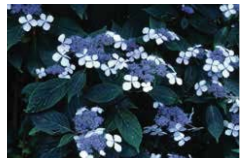
Hydrangea serrata 'Blue bird'

Uiterst rechts, in tegenstelling tot de bolvormige hortensia links: de schermhortensia Hydrangea macrophylla 'Blaumeise' (ofwel 'pimpelmees'). Als in de zomer tussen 12 en 5 uur 's middags de zon schijnt, zouden de planten met de lichtgekleurde bloemen eigenlijk in de schaduw moeten staan. Als de 'Blaumeise' veel aluminiumsulfaat krijgt toegediend en in zure grond staat, is het een van de beste blauwe schermbloemen. In kalkrijke grond en zonder of met weinig aluminiumsulfaat worden de steriele bloemen roze. Het is een krachtig groeiende struik. De bloeiwijzen zijn samengesteld uit een kring van steriele bloemen met enigszins getande rand. De bloemen beginnen vaak al einde juni te bloeien en tot eind september zie je nieuwe bloemen. De plant is goed winterhard. Normaliter wordt de plant na ongeveer tien jaar zo'n 1,5 meter hoog. Zet deze Hortensia niet in de felle zon, maar in halfschaduw.