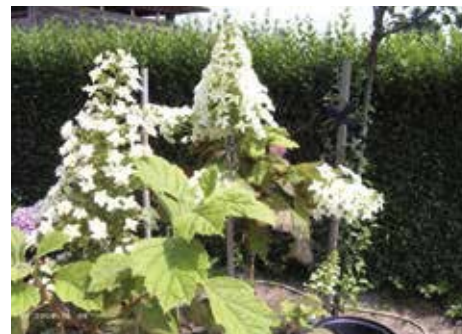
Hydrangea quercifolia 'Hovaria'

Hydrangea quercifolia . Van Noordenburg: 'Deze foto van de eikenbladhortensia werd ons toegezonden door een familie, die deze 'Hovaria' op stam' een paar jaar eerder bij ons had aangekocht. Op deze foto kun je mooi zien dat deze hortensia zowel eikenblad heeft als een mooie pluim.' De eikenblad-