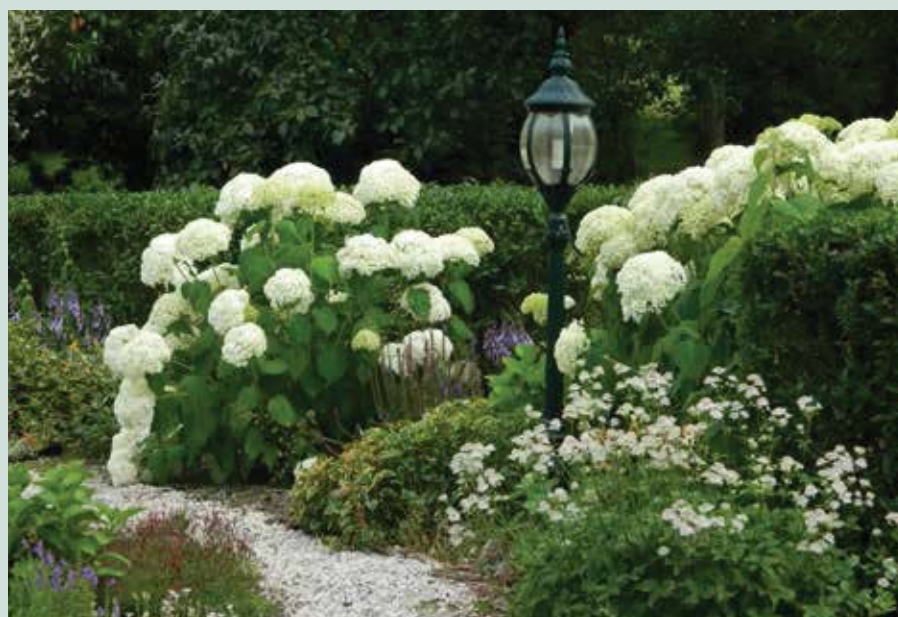
Hydrangea arborescens 'Annabelle'

Hydrangea is waarschijnlijk zo genoemd omdat het een plant is die veel water nodig heeft 'Hydra', afgeleid van hydôr, betekent water