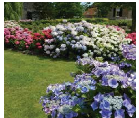
Hydrangea macrophylla 'Blaumeise'

men met een plat of koepelvormig scherm van kleine fertiele bloempjes met daaromheen een aantal randbloemen. Ook hier is blauwkleuring mogelijk. De Hydrangea macrophylla -struiken zullen bijna altijd tussen de een en twee meter hoog worden. Er zijn een enkele uitzonderingen, waar de hoogte onder de 100 cm zal blijven. De macrophylla 's met witte en heel licht gekleurde bloemen, kunnen beter niet in de volle middagzon worden geplaatst.