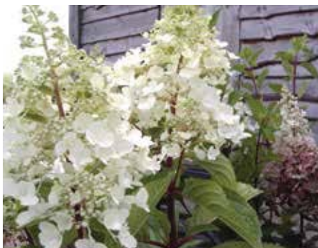
Hydrangea paniculata 'PinkyWinky' net in bloei