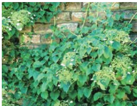
Hydrangea anomala 'petiolaris'

ondersteund te worden. Het is een niet erg grote struik, die ongeveer 100 cm hoog zal worden. In het voorjaar kan hij worden gesnoeid. Omdat de bloemen verschijnen aan de takken van het nieuwe jaar, heeft snoei geen gevolgen voor de bloei. Ze zullen rijk bloeien. De bloeitijd is juni-september. De plant is zeer winterhard en men hoeft niet bevreesd te zijn dat bloemknoppen door late nachtvorst zullen sterven.