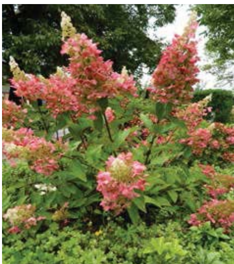
Hydrangea paniculata 'PinkyWinky' in de nabloeifase