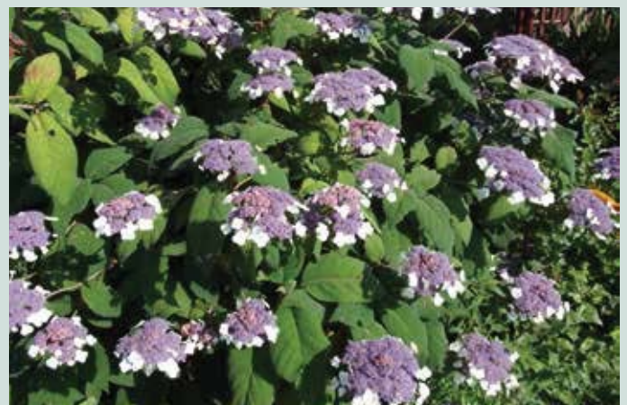
Hydrangea aspera 'Macrophylla'

'Bluebird' het meest geschikt als vakbeplanting. In het kader van de biodiversiteit en het meer en meer toepassen van vaste planten in de openbare ruimte zou hortensia een prima plaats kunnen krijgen in combinatie met vaste planten, dus in een combinatieborder. In privétuinen en in parken is de hortensia een onmisbare plant. Hydrangea arborescens 'Annabelle' is door het omvallen niet geschikt voor de openbare ruimte. Er zijn op dit moment prima – met name compactere – vervangers beschikbaar. Een voorbeeld is de Hydrangea macrophylla 'Schneeball'. Hydrangea aspera 'Macrophylla' is een voorbeeld van een soort die wij kweken als solitaire. Een prachtig voorbeeld voor in combinatie met siergrassen.