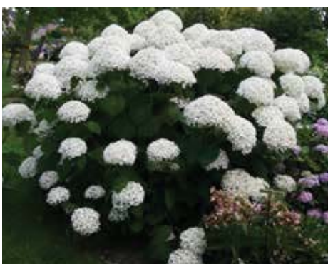
Hydrangea arborescens 'Incrediball'

Hydrangea arborescens 'Incrediball'. De 'Incrediball' wordt ook wel de Strong Annabelle genoemd. Deze arborescens heeft donkergroen blad en grote bolvormige bloemen. Het verschil met de van oorsprong populaire 'Annabelle' is dat deze 'Incrediball' mooie stevige takken heeft, waardoor het gaan hangen of zelfs knakken van de bloemstelen niet voorkomt. De zware bloemen behoeven niet