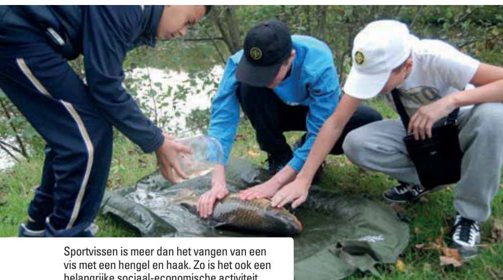
Sportvissen is meer dan het vangen van een vis met een hengel en haak. Zo is het ook een belangrijke sociaal-economische activiteit.