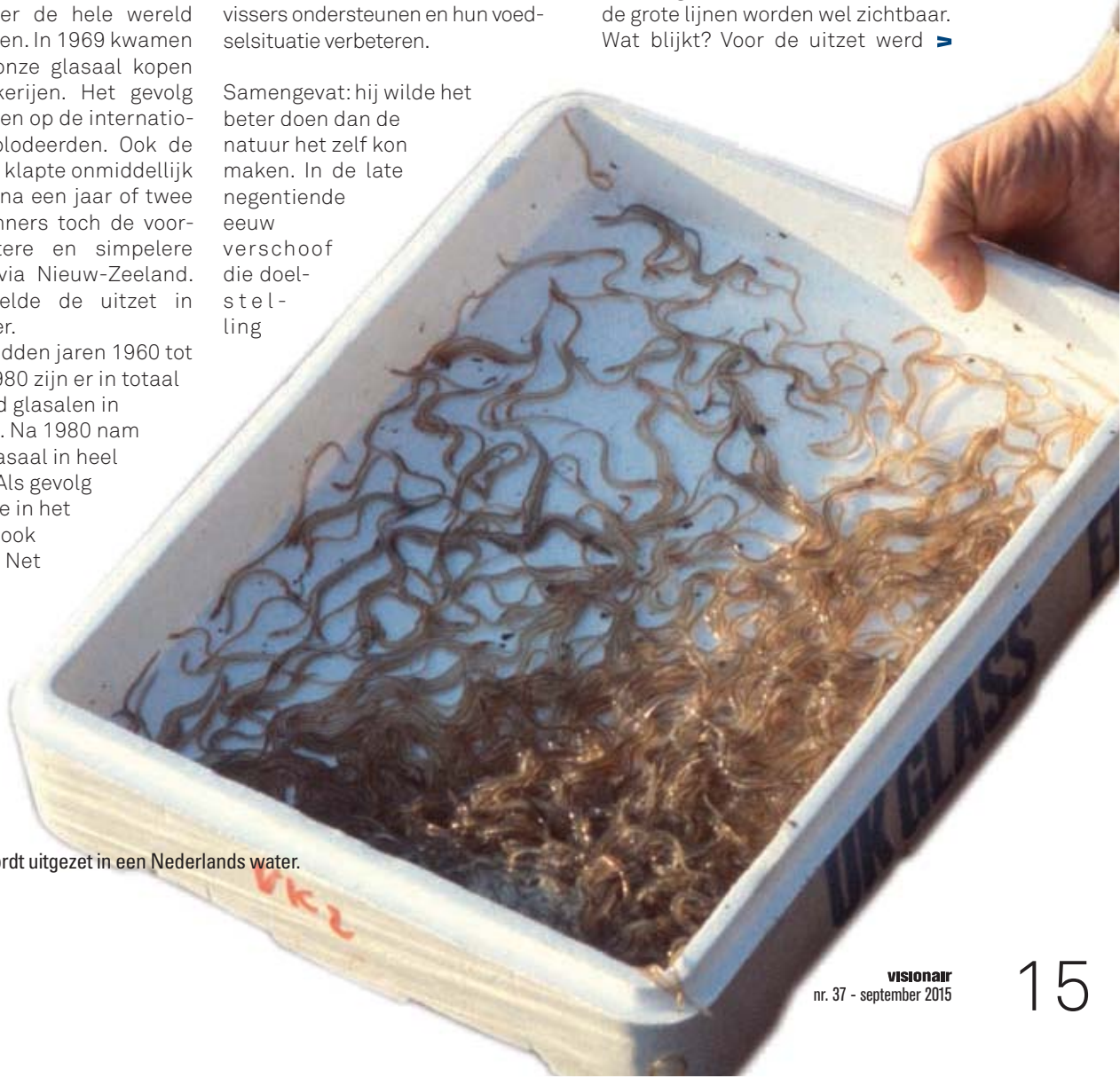
Engelse glasaal wordt uitgezet in een Nederlands water.

In de tabel op bladzijde 14 hebben we de resultaten samengevat: hoeveel is er uitgezet (in totaal en per jaar), hoeveel glasaal werd er tegelijkertijd in Frankrijk verhandeld, hoeveel heeft de uitzet geproduceerd en hoeveel aal werd er toen überhaupt in Europa gevangen? We rekenen dat -gemiddeld over heel Europa- elke kilogram glasaal ongeveer honderd kilogram volgroeide aal kan opleveren (3.500 glasalen per kg, 10% overleving, gemiddeld 300 gram per volgroeide aal). Het zal duidelijk zijn dat deze reconstructie de nodige onzekerheden kent maar de grote lijnen worden wel zichtbaar. Wat blijkt? Voor de uitzet werd ➤