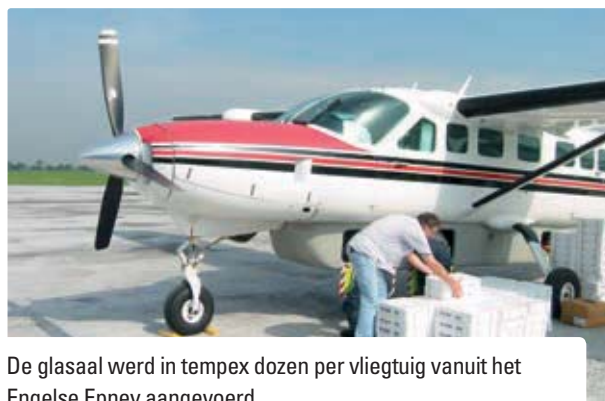
De glasaal werd in tempex dozen per vliegtuig vanuit het Engelse Epney aangevoerd.

navië, Polen, de Baltische staten, Tsjecho-Slowakije en Nederland. Bijna de helft van de Epney-glasaal ging naar deze andere landen. Dit was een bewust beleid om kennis en materiaal te verspreiden. In deze context hebben ook de eerste Nederlandse uitzettingen plaatsgevonden. Daarbij werden pogingen ondernomen om glasaal of pootaal in Nederland zelf te vinden. Pas na 1945 zijn er in ons land 'niet-Duitse' glasaalplannen uitgevoerd.