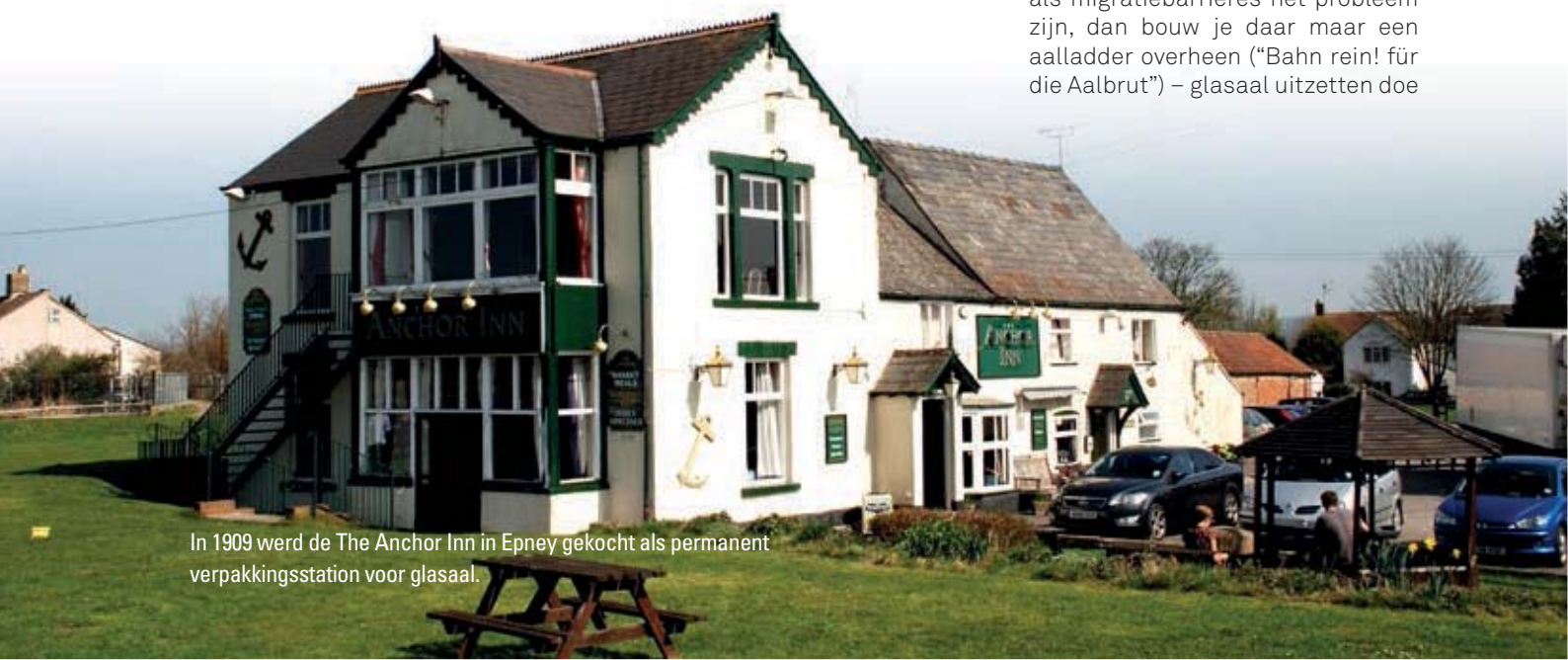
In 1909 werd de The Anchor Inn in Epney gekocht als permanent verpakingsstation voor glasaal.

midden van de negentiende eeuw. In de grote rivieren van Europa werd veel jonge aal aangetroffen, tot op grote afstand van de zee. Onder de waterval van Schaffhausen (Zwitserland) werden emmers vol glasaal gevangen. Kom daar tegenwoordig nog eens om. Naarmate die eeuw verstreek, kwamen er meer en meer geluiden dat moderne waterwerken en vervuiling toch een belemmering gingen vormen voor de intrek. Zo ontstond de behoefte om het afnemende bestand aan te vullen door glasaal uit te zetten boven de barrières. Aan het eind van de negentiende eeuw was der Deutsche Fischerei-Verein nog overbiddelijk: als migratiebarrières het probleem zijn, dan bouw je daar maar een aalladder overheen ("Bahn rein! für die Aalbrut") – glasaal uitzetten doe