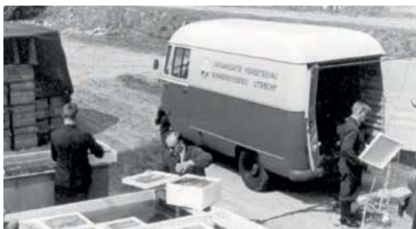
Na de Tweede Wereldoorlog werd de OVB verantwoordelijk voor de import en uitzet van glasaal in Nederland.