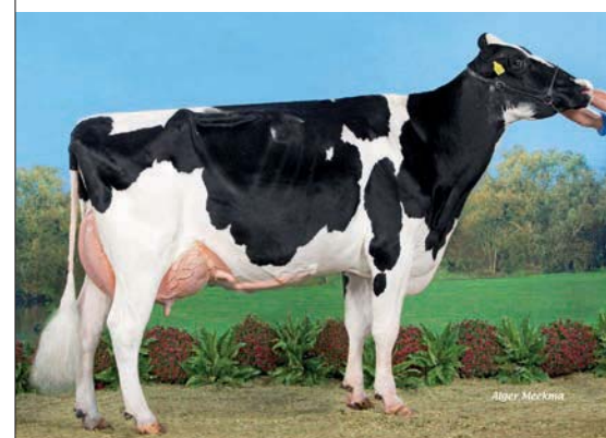
KD Doetje 89 (v. Goldwyn), kampioene oude koeien Prod.: 4.10 323 13.814 4,53 3,42 lw 126