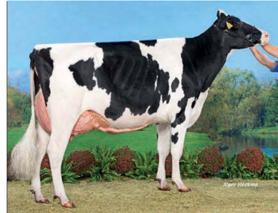
Hemrik Holstein Braxton Amber (v. Braxton), vaarzenkampioene Prod.: 2.02 289 11.264 3,48 3,33 lw 124 l.l.

Voor het algemeen kampioenschap ging het echter tussen de jongere kampioenen Jaan en Amber. De imponerende melkuitstraling van Amber ten spijt won Jaan – nipt – dankzij één kalving meer. |