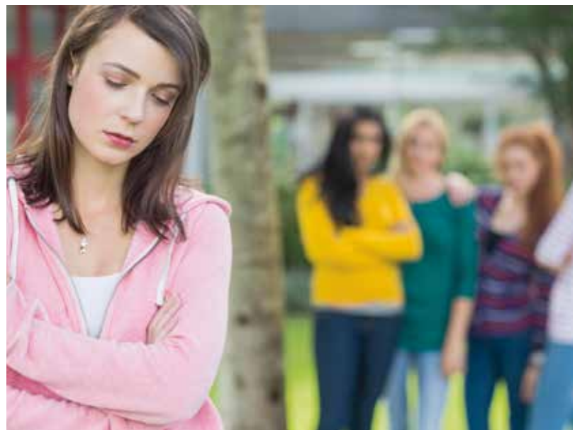
Pesten staat hoog op de agenda van scholen en politiek

Pesten is een groepsverschijnsel. Voor sommige leerlingen maken pesterijen de school tot 'a jungle out there'. Overleven in die jungle kost veel energie, dan blijft er minder over voor groei, ontwikkeling, leren. De scholen moeten pesten op een effectieve wijze tegen gaan. Alle jongeren hebben recht op een onbezorgde schooltijd die in het teken staat van ontwikkelen, ontdekken en leren. Jongeren kunnen pas leren in een omgeving waar goed met elkaar wordt omgegaan, waar ze leren elkaar te respecteren. De ongreepbaarheid van het fenomeen pesten maakt de aanpak des te moeilijker. Pesten staat hoog op de agenda van scholen en politiek. Ernstige incidenten gerelateerd aan pesten zorgen ervoor dat steeds vaker de vraag gesteld wordt hoe het kan dat er op een school structureel gepest werd zonder dat daar actie op volgde. Gesprekken over pesten worden fundamenteeler en gaan over de vraag welke