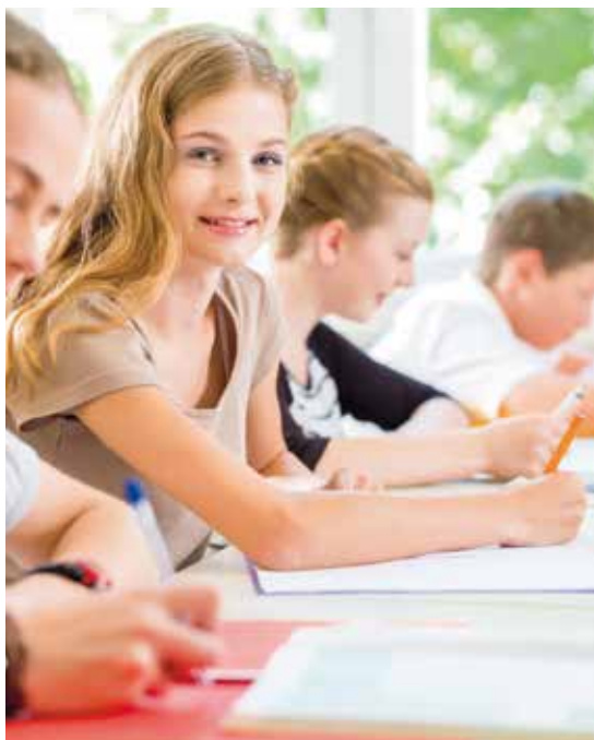
Een veilige omgeving bieden vraagt om een proactieve houding van de schoolleiding en docenten en andere actoren

Per 1 augustus zijn scholen in het voortgezet onderwijs en ook primair onderwijs – als gevolg van een aanpassing van de onderwijswetten – verplicht zorg te dragen voor een veilige school. Door de wetswijziging moeten scholen aan een inspanningsverplichting voldoen om een actief veiligheidsbeleid te voeren. Ook moet het effect van een veiligheidsbeleid periodiek gemonitord worden en tenminste één persoon moet het anti-pestbeleid coördineren en fungeren als vast aanspreekpunt in het kader van pesten. De onderwijsinspectie heeft de taak om toe te zien op naleving van de wettelijke verplichtingen.