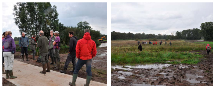
Herinrichting van het Deurzerdiep (ten oosten van Assen)

Bij het Deurzerdiep wordt momenteel een vernattingsproject uitgevoerd, gericht op natuurontwikkeling, waterberging en recreatie (het grenst aan de stad Assen). De oude, rechte beek was door een zandkop gegraven en het omringende gebied was in landbouwkundig gebruik. Deze beek is nu gedempt met grond van de toplaag van het omringende gebied, er is een nieuwe, ondiepe slenk gegraven met heel veel meanders en er zijn fiets- en wandelpaden aangelegd. Het water mag hier nu over zijn oevers treden en vrij door het beekdal stromen. In een in 2012 ingericht (geplagd) deel groeien nu al veel grote zeggen (Noordse -, Scherpe - en Moeraszegge). Rondom de slenk is extensief begrazingsbeheer, daarnaast wordt er gemaaid om het landschap open te houden en doorstroming te garanderen bij extreme piekafvoeren in de winter.