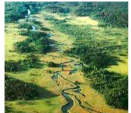
Camiel Aggenbach Doorstroom-veenlandschap in Polen

Zo'n 1100 jaar geleden bestond de helft van Nederland nog uit veenmoeras. Dit lag vooral in het noorden en westen van Nederland en in de beekdalen. Ook in de huidige beekdalen van het Drents plateau kwamen venen voor. Deze lagen vaak rond kronkelende riviertjes, werden door grondwater gevoed en bestonden uit moerassen en moerasbossen. Veel van de oorspronkelijke venen waren zogenoemde doorstroom-systemen, waarin het water via de flexibele bovenlaag van het veen werd afgevoerd. In de loop van de tijd zijn deze gebieden steeds meer ontwaterd door begreppeling en in gebruik genomen; eerst extensief als hooiland en later steeds intensiever. Daardoor is de veenbodem sterk veranderd en voedselrijker geworden. In Nederland zijn nauwelijks nog natte beekdalvenen over gebleven. Goed ontwikkelde ongestoorde beekdalvenen zijn er nog wel in bijvoorbeeld Polen.