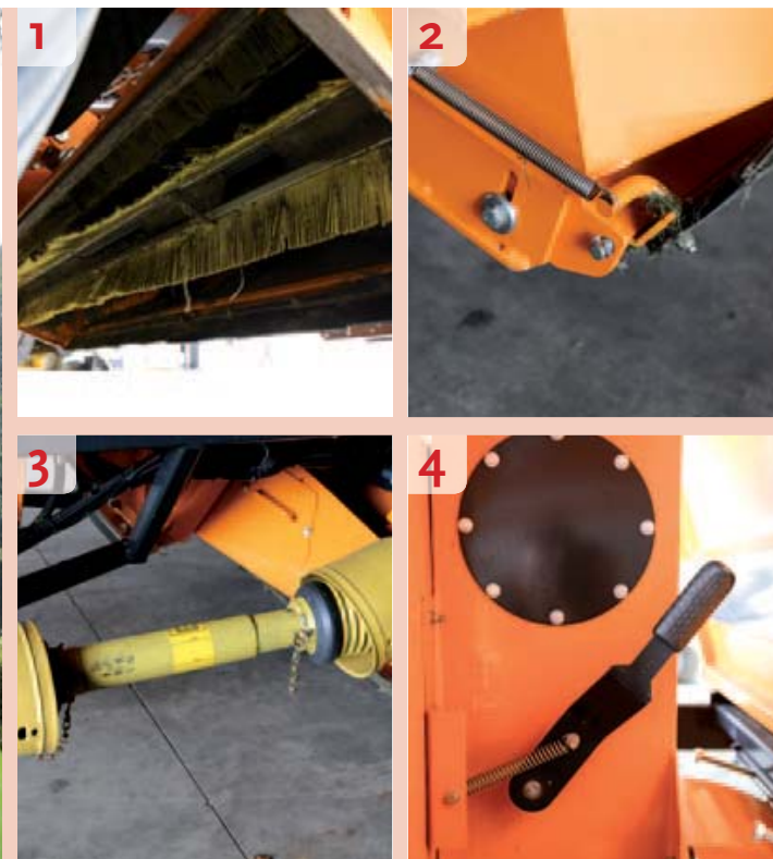
Bij de foto's 1 - 4

Zuigbak De VT420 is hoofdzakelijk bedoeld voor de kleine klussen in plantsoenen, golfbanen en het openbaar groen. Voor het opvangen van