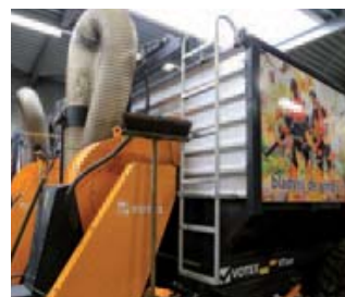
Biga Groep heeft op alle zuigwagens een trap gemonteerd. Als het laatste restje er niet uit wil kun je er eenvoudig in klimmen.