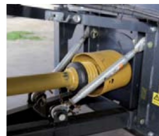
De drossel is in hoogte verstelbaar en naar keuze onwisselbaar voor onder- of boventrehaak. De aftakas heeft standaard een groottoekkoppeling.