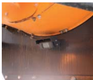
De machine van gemeente Menterwolde heeft onderop een camera, voor zicht op de zuigbak. Takken blokkeren soms de toever.