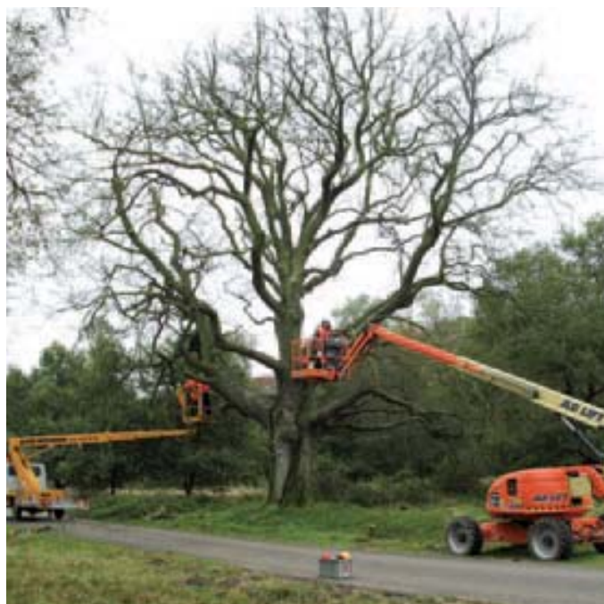
Twee typen hoogwerkers. Links de hoogwerker op een auto. Die is niet zo mobiel als zelfrijder rechts met een wielonderstel.