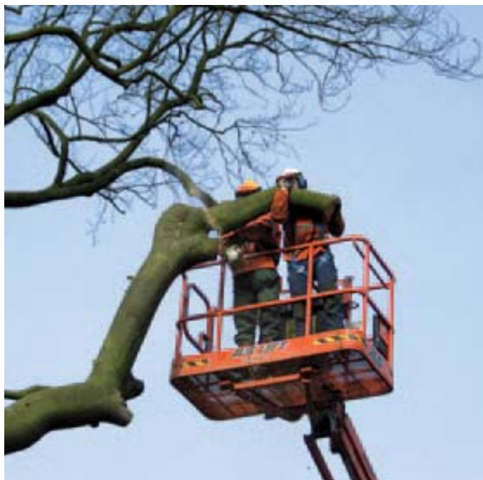
Met twee man in de werkbak kan één man zagen en de ander de afgezaagde stammen en takken vasthouden en afvoeren.

Veel verhuurders hanteren voor hoogwerkers een weekprijs die ongeveer net zo hoog is als drie dagprijzen. "Om daar optimaal van te profiteren, moet je eigenlijk je werk zo plannen dat je een klus hebt waarvoor je een week een hoogwerker nodig hebt." ■