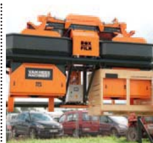
▲ Dubbele kistenvuller De Dubbele Bunkervuller van VHM heeft met 90 kisten per uur een enorme capaciteit. De heftruckchauffeur houdt de kist op de lepels tot deze vol is en kan de kist daarna meteen wegbrengen. Door een wigvorm in de bunker, kan geen stortkegel ontstaan.