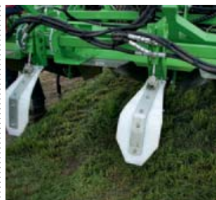
▲ Happers tegen erosie Voor de teelt in heuvelachtige regio's kan AVR hydraulisch aangedreven happers achter de rijenfrees leveren. De kunststof schep hapt om de zoveel tijd in de grond. Die gevormde hopen voorkomen dat vruchtbare grond afstroomt tijdens hevige regenbuien.