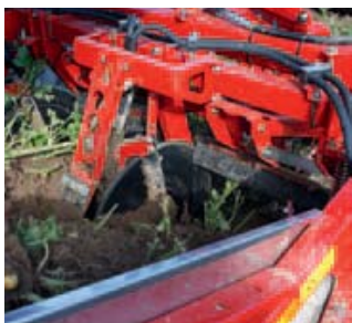
▲ Hydraulische schijven op Grimme Grimme kan zijn tweerijige verstekrooiers voortaan leveren met hydraulisch aangedreven schijven en zonder diabolos. Daarmee moet het makkelijker rooien onder moeilijke omstandigheden. Tasters op de rug bepalen de rooidiepte.