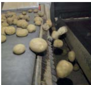
▲ Kluitenscheider Bij de kluitenscheider van Tolsma-Grisnich wordt het product over een magneet gevoerd. Even verderop schieten rubberen stoters de gemagnetiseerde kluiten uit de stroom. Bij 10 procent kluiten is de nauwkeurigheid volgens Tolsma-Grisnich 95 procent.